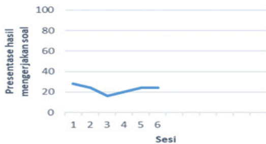
Gambar 1. Grafik Baseline 1 (A-1)

Langkah pertama dalam pengambilan data ialah melakukan pengukuran kemampuan subjek dalam mengerjakan soal materi kepramukaan sebelum diberikannya intervensi. Pengumpulan data ini disebut baseline (A-1) yang dilakukan 12 kali sesi grafik dapat dilihat pada gambar 1 . .