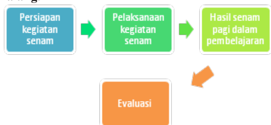
Gambar 2 Bagan Pelaksanaan Senam Pagi Dalam Upaya Membangun Motivasi Belajar Siswa Tunagrahita Mampu Didik di SMPLB Putra Jaya Malang.

Jenis evaluasi yang terdapat dalam evaluasi program kegiatan senam pagi serta penjelasan