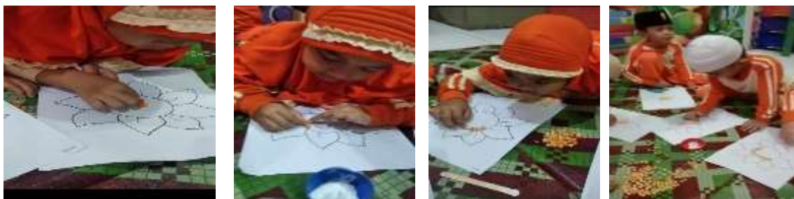
Gambar 1. Proses Kolase Gambar Bunga dengan Biji Jagung