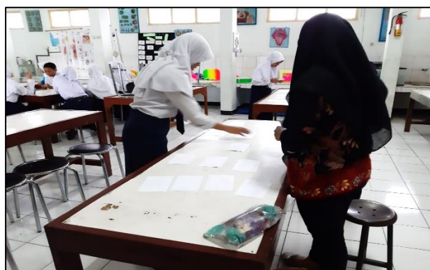
Gambar 4 Siswa memasang gambar dengan deskripsinya dalam Bahasa Inggris

Kegiatan pelatihan Bahasa Inggris yang keempat yaitu pelatihan berbicara dalam Bahasa Inggris dengan permainan Bentengan. Permainan bentengan juga salah satu permainan tradisional yang menjadi sarana pelatihan Bahasa Inggris. Permainan ini cukup unik pada saat dipadu padankan dengan kegiatan pelatihan Bahasa Inggris karena para peserta berkesempatan untuk dapat belajar memberikan instruksi dalam Bahasa Inggris seperti Gambar 5. Pada kegiatan pelatihan Bahasa Inggris yang kelima, pelatihan berbicara dalam Bahasa Inggris dikemas dalam bentuk permainan Engklek. Permainan Engklek ini dimodifikasi oleh tim pengabdian dengan menggunakan uang kertas mainan. Pada permainan ini, setiap anggota kelompok bertugas untuk meletakkan uang mainan pada kotak area permainan yang selanjutnya akan diambil oleh salah satu anggota kelompok dengan mata tertutup pada waktu yang telah ditentukan dan dilakukan dengan cara engklek yang tambak pada Gambar 6. Pada permainan ini, peserta lain bertugas memberikan instruksi dengan menggunakan Bahasa Inggris. Sehingga permainan ini mengajarkan koordinasi dan komunikasi yang efektif dengan Bahasa Inggris.