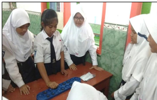
Gambar 2 Siswa mengikuti pelatihan Bahasa Inggris melalui Permainan Dakon

Kegiatan pelatihan Bahasa Inggris dilaksanakan setiap seminggu sekali pada jam ekstra kurikuler siswa. Kegiatan pelatihan Bahasa Inggris yang pertama dilakukan dengan permainan Dakon yang diawali dengan pengenalan permainan Dakon kepada siswa sebagai perwujudan pelestarian budaya lokal. Kegiatan pelatihan dengan permainan Dakon berjalan dengan baik dan para peserta pelatihan antusias dalam mengikuti pelatihan karena para peserta tertarik dengan permainan Dakon seperti pada Gambar 2. Selain pengenalan permainan Dakon, pada kegiatan ini para peserta juga berkesempatan untuk praktik berbahasa Inggris dengan menggunakan kartu-kartu kosakata yang telah disiapkan oleh tim pengabdian.