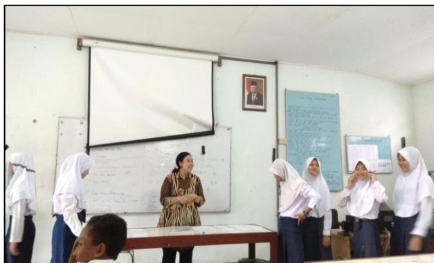
Gambar 5 Siswa mengikuti pelatihan Bahasa Inggris melalui Permainan Bentengan Sumber: Tim Pengabdian (2020)