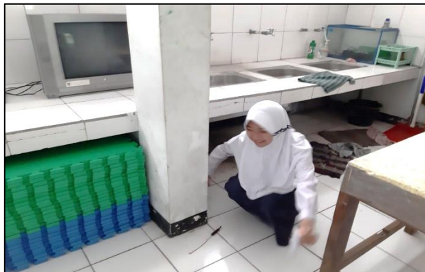
Gambar 3 Siswa mengikuti pelatihan Bahasa Inggris melalui Permainan petak Umpet