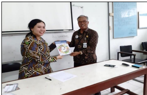
Gambar 1 Penyerahan Buku oleh Tim Pengabdian pada Pihak Sekolah

Kegiatan pelatihan Bahasa Inggris dilaksanakan setiap seminggu sekali pada jam ekstra kurikuler siswa. Kegiatan pelatihan Bahasa Inggris yang pertama dilakukan dengan permainan Dakon yang diawali dengan pengenalan permainan Dakon kepada siswa sebagai perwujudan pelestarian budaya lokal. Kegiatan pelatihan dengan permainan Dakon berjalan dengan baik dan para peserta pelatihan antusias dalam mengikuti pelatihan karena para peserta tertarik dengan permainan Dakon seperti pada Gambar 2. Selain pengenalan permainan Dakon, pada kegiatan ini para peserta juga berkesempatan untuk praktik berbahasa Inggris dengan menggunakan kartu-kartu kosakata yang telah disiapkan oleh tim pengabdian.