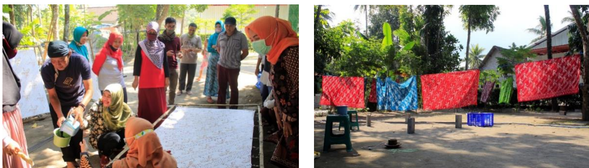
Gambar 5 Kegiatan Pewarnaan & Penjemuran

Kegiatan hari kedua yaitu pewarnaan kain, penguncian warna dengan waterglaas, penjemuran, pelorodan, pencucian, dan penjemuran kembali (lihat gambar 4). Kegiatan ini berhasil membuat peserta semangat dan antusias dalam membatik, karena peserta belum pernah mengenal teknik-teknik dalam membatik sebelumnya. Sementara itu, salah satu peserta pelatihan menyatakan dengan mengikuti pelatihan yang diadakan UM ini ia mendapatkan pengetahuan, pengalaman, dan ilmu baru dalam hal membatik, ujanya. Melalui kegiatan ini diharapkan akan ada inovasi-inovasi baru pengembangan desain motif batik reyog bulkiyo yang lebih variatif lagi seraya memperkenalkan budaya khas daerah (reyog bulkiyo) lewat kain batik ini.