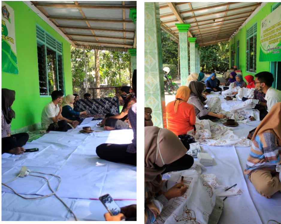
Gambar 4 Prose Mencap dan Mencanting

berkolaborasi dengan masyarakat desa untuk mengembangkan motif batik khas Desa Kemloko yaitu batik reyog bulkiyo”.