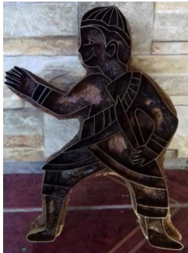
Gambar 2 Motif Penari Reyog Bulkiyo

Berdasarkan komponen tersebut, kemudian dikembangkan menjadi motif batik. Pertama, motif penari reyog bulkiyo, motif ini dikembangkan dan terinspirasi dari penari reyog bulkiyo. Kedua, motif slompret, motif ini dikembangkan dari komponen alat musik tari reyog bulkiyo. Alat musik ini termasuk alat musik tiup yang berbentuk seperti terompet. Suara slompret paling dominan saat pementasan reyog bulkiyo. Ketiga, motif barong, diambil dari busana yaitu jarik atau jarit barong yang digunakan penari. Keempat motif sinar rembulan, motif sinar rembulan terinspirasi dari pementasan tari ini yang dilaksanakan pada malam hari. Sinar rembulan memberikan cahaya terang dan indah, sehingga bisa mempengaruhi suasana hati para penonton saat melihat pementasan. Motif-motif tersebut terdapat pada gambar 1 dan 2 berikut.