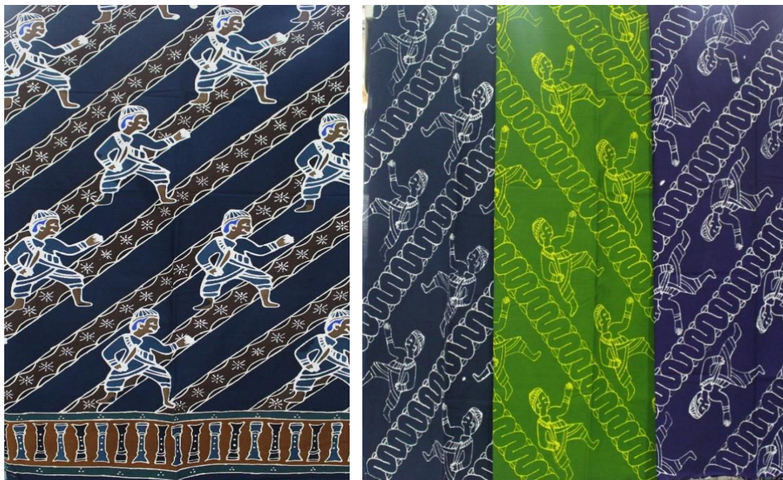
Gambar 6 Motif Baru Pertama dan Kedua Batik Reyog Bulkiyo

Hasil batik reyog bulkiyo terdiri dari dua variasi baru (lihat gambar 5). Motif baru pertama terdiri dari kombinasi 3 motif yaitu penari reyog bulkiyo, slomporet, dan sinar rembulan. Sedangkan motif baru kedua terdiri dari dua motif yaitu motif penari reyog bulkiyo dan barong.