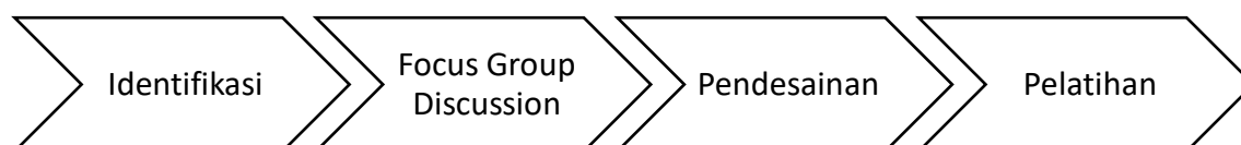
Gambar 1. Bagan Alur Metode Pelaksanaan Kegiatan Pemberdayaan Masyarakat

Untuk mencapai tujuan yang telah dikemukakan di atas, maka diperlukan metode serta tahapan pemberdayaan masyarakat yang sesuai. Metode utama yang diperlukan untuk mencapainya adalah dengan cara menyelenggarakan kegiatan pelatihan yang didalamnya terintegrasi dasar-dasar teoritis sekaligus praktik langsung dalam kegiatan membatik. Adapun secara keseluruhan terdapat empat tahap yang dilakukan dalam kegiatan pemberdayaan masyarakat ini, yang dapat dilihat Gambar 1.