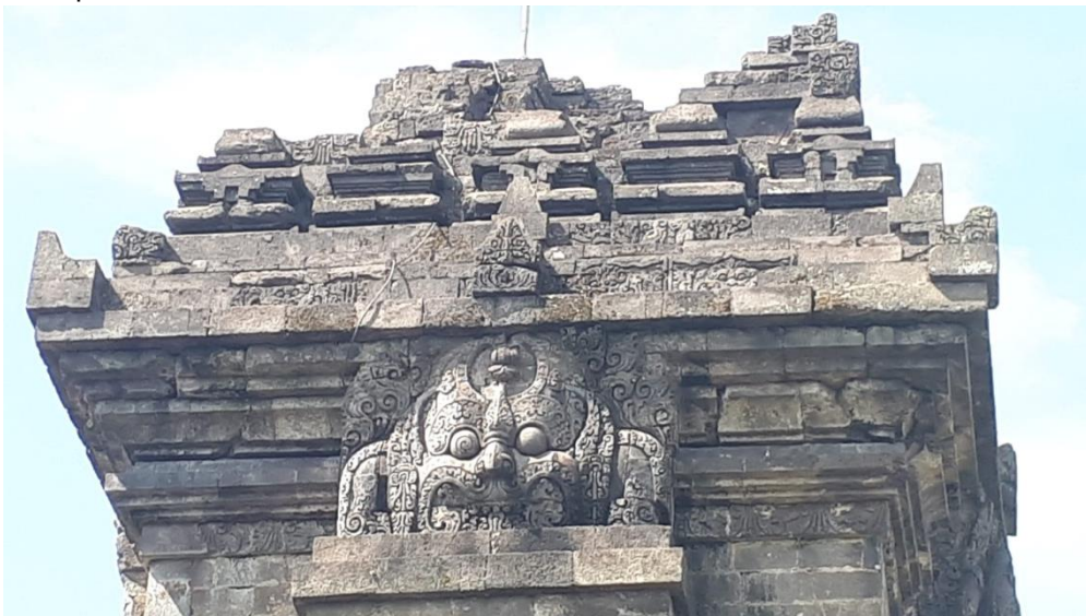
Gambar 2. Motif Ragam Hias di Kepala Kala dan Atap Candi

Pertama, motif ragam hias di bagian atas candi. Motif ragam hias yang pertama kali dapat diidentifikasi adalah yang ditemukan di area tubuh dan kepala Candi Singosari. Sebagaimana bisa dilihat pada Gambar 2.