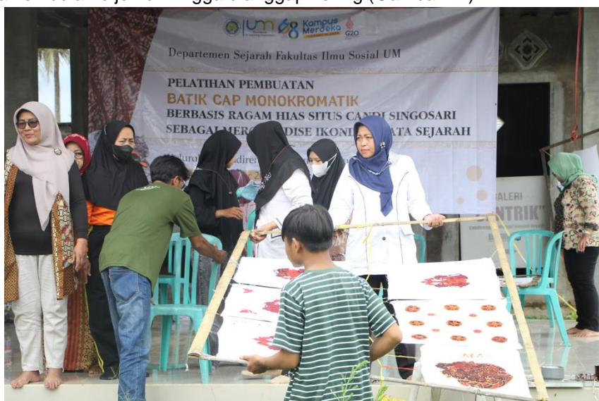
Gambar 12. Proses Penjemuran

Praktik ketiga, adalah pewarnaan pada motif batik yang telah diberi malam. Pemberian warna ini untuk menghasilkan kontras warna diantara motif yang telah dibatikan. Kain batik yang telah dicanting harus dihamparkan dengan cara diikat pada penampang yang terbuat dari bambu. Setelah terhampar, peserta kemudian memberi warna kepada motif batiknya. Terdapat dua warna kontras yang bisa dilukiskan peserta kepada media batiknya. Setelah itu, motif batik yang telah diberi warna kemudian dijemur hingga dianggap kering (Gambar 12).