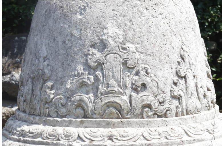
Gambar 7. Motif Tumpal dan Sulur di Kepala Dogoba

Ketujuh, motif tumpal dan sulur-suluran di fragmen kepala dogoba. Motif tumpal yang dipadu dengan sulur-suluran pada fragmen kepala Dagoba (atas Stupa) ini juga potensial untuk dijadikan motif batik. Bentuk sulur-suluran pada Dagoba tersebut dapat dijadikan inspirasi pembuatan desain motif batik tulis khas Singosari (Gambar 7).