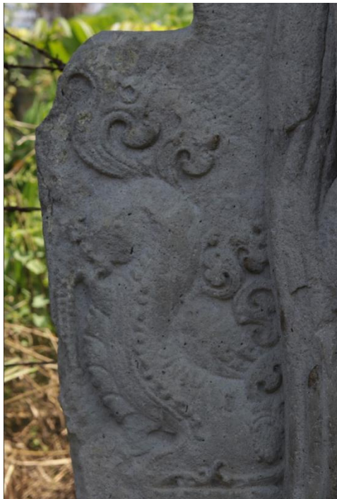
Gambar 6. Motif Makara di Arca

Keenam, motif makara di samping fragmen arca. Motif Makara biasanya merupakan rangkaian atau ujung kepala Kala yang menggambarkan makhluk mitologi dalam wujud seperti penggabungan hewan gajah atau buaya. Motif Makara banyak ditemukan pada candi-candi beraliran Hindu. Motif Makara ini juga potensial untuk dijadikan motif batik jika menyertakan motif ragam hias yang ada di sekitarnya, berupa sulur-suluran (Gambar 6).