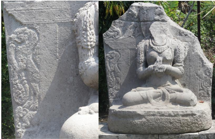
Gambar 9. Arca Prajna Paramitha di Komplek Candi Singosari

kemiripan nama dengan Singosari. Meski memang nama Singha ini bukan menjadi dasar penamaan wilayah maupun nama Kerajaan Singhasari. Tetapi setidaknya motif tersebut dinilai lebih mampu menggambarkan kekhasan Singosari dan sekaligus berpotensi sebagai motif ragam batik khas Singosari yang dapat dirupakan sebagai desain batik tulis.