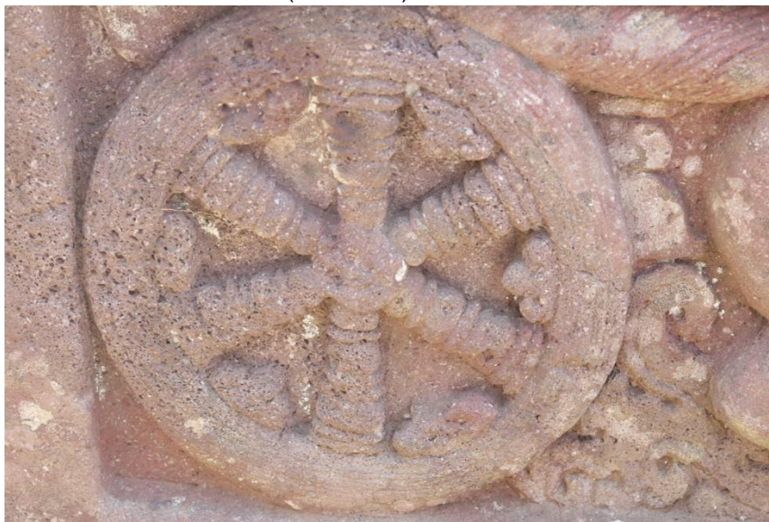
Gambar 4. Motif Roda pada Asana Arca Dewa Surya

Ketiga, motif roda di Asana Arca Dewa Surya. Selain motif ceplik, pada lapik arca Dewa Surya juga terdapat motif roda yang menghiasi Asana milik Dewa Surya. Meski terlihat sederhana, motif ini sebenarnya memiliki makna filosofis yang mendalam karena menggambarkan roda kehidupan sekaligus sebagai wujud sang Surya yang selalu menyinari dunia. Motif ini juga potensial dijadikan motif batik cap yang bisa dimanfaatkan sebagai desain tambahan di sekitar motif utama batik (Gambar 4).