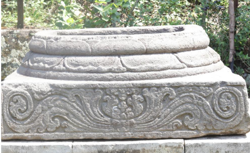
Gambar 5. Motif Sulur di Bawah Padmasana Tanpa Arca

Keempat, motif sulur pada padmasana milik arca yang tidak dapat diidentifikasi. Motif ini juga bisa disebut sebagai Patra Punggel (Mulyadi et al., 2015). Pada salah satu fragmen arca di sekitar Candi Singosari, ditemukan lapik arca yang sudah tidak dapat lagi diidentifikasi arca apa karena sudah tidak lagi berada di tempat asalnya. Hanya saja, pada lapik arca tersebut, terdapat ragam hias berupa motif sulur-gelung yang juga memiliki potensi untuk dijadikan motif batik tulis. Motif ini dapat dijadikan motif pendamping yang menghiasi motif utama. Motif sulur ini dapat dilihat pada Gambar 5.