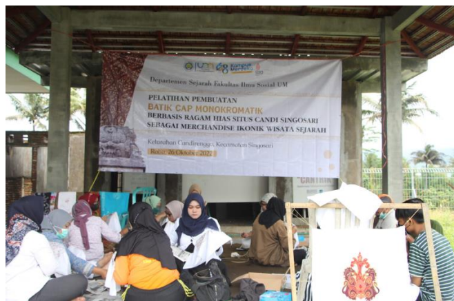
Gambar 11. Proses Pembuatan Pola Batik

Praktik kedua, peserta mulai dilatih cara menuliskan batik ke kain. Mereka harus mencelupkan canting ke malam, lalu menggoreskannya ke kain yang akan dibatik dengan hati-hati agar tidak melewati garis pola. Mereka juga harus dengan penuh kesabaran menggoreskan canting agar malam tidak tercecer atau menetes di luar pola batik. Seringkali peserta melakukan kesalahan-kesalahan tersebut. Tapi tim pelatih memberi penguatan bahwa hal itu adalah wajar karena batik adalah seni, dan seni dihargai karena tidak bisa direplikasi oleh orang lain, termasuk kesalahan-kesalahan yang telah dilakukan oleh peserta tadi. Proses pembuatan batik disajikan pada Gambar 11.