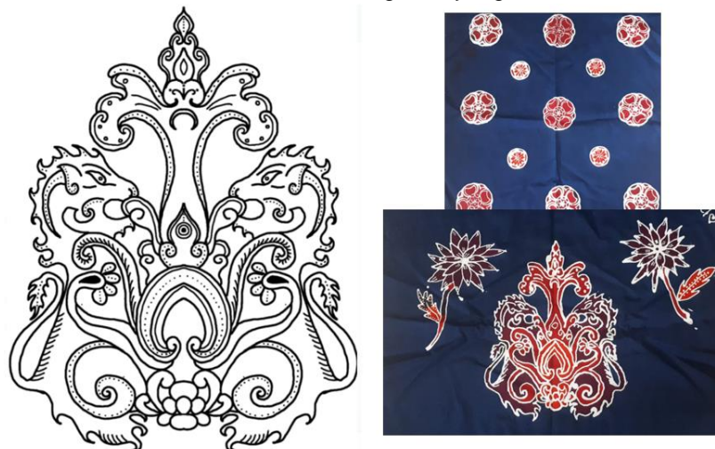
Gambar 10. Motif Batik Singhāsana Padma dan Contoh Produk Hasil Pelatihan

Setelah ditetapkan motif ragam hias yang akan dikembangkan sebagai desain batik khas Singosari, tim pengabdian kemudian melakukan konsultasi kepada tim Batik Soendari untuk mengembangkannya sebagai motif batik. Proses pendesainan memerlukan waktu yang cukup lama, dari bulan September hingga Oktober 2022. Hal ini terjadi karena tim pengabdian dengan tim pendesainan membutuhkan waktu untuk memantapkan apakah ragam hias yang ada di Candi Singosari sudah termanifestasi dalam desain batik yang dihasilkan tim Batik Soendari. Gambar 10 merupakan hasil akhir desain batik motif khas Singosari yang dihasilkan.