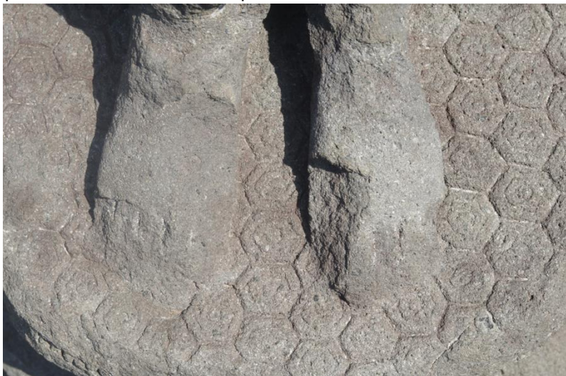
Gambar 8. Motif Hexagonal pada Pedestal Fragmen Arca

Kedelapan, motif hexagonal pada pedestal fragmen arca. Motif ini terdapat pada pedestal atau lapik arca di salah satu fragmentasi arkeologus yang ada di kompleks Candi Singosari. Motif ini juga menarik untuk dijadikan motif batik, khususnya jika dijadikan motif pendamping dengan teknik batik cap. Motif tersebut bisa dilihat pada Gambar 8.