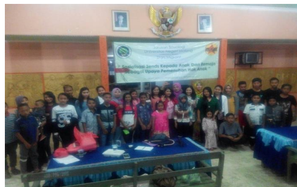
Gambar 3. Seluruh Peserta Sosialisasi 3-Ends (Sumber: Dokumentasi Penulis, diambil pada 20 Juni 2017 pada 11.17 WIB).

Banyak peserta yang bertanya kepada pemateri secara personal tentang masalah yang dihadapinya, ada juga yang bertanya tentang apakah pola asuh yang telah ia berlakukan selama ini sudah benar atau belum. Dari banyaknya pertanyaan yang diajukan menunjukkan bahwa peserta sangat antusias dalam kegiatan pelatihan dan memiliki keinginan untuk menambah pengetahuan baru yang selama ini mereka tidak ketahui. Adanya hadiah atau doorprizes