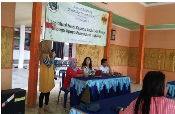
Gambar 2. Pendamping anak mengikuti sesi tanya jawab pada kegiatan Sosialisasi 3-Ends

Seperti contohnya bullying, tidak hanya di kota besar namun faktanya kini bullying sudah terjadi di desa. Dengan pengetahuan orangtua yang sangat terbatas tentang bullying, banyak dari orangtua yang tidak tau bahwa anak mereka telah menjadi korban bullying dan orangtua tidak tau bagaimana cara untuk mengatasi masalah bullying. Dengan tanya jawab dengan pemateri, maka dijelaskan tentang bullying itu yang seperti apa, bagaimana cara menanggulangnya, dan bagaimana sikap orangtua jika anaknya menjadi korban bullying. Dengan diberikan contoh yang merupakan dari pengalaman pemateri sendiri, peserta menjadi mudah memahami tentang bullying dan cara mengatasinya.