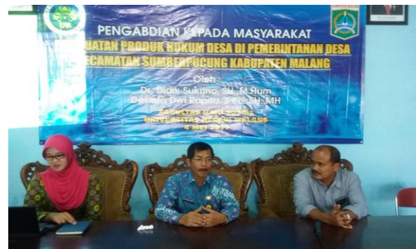
Gambar 2. Pembukaan Oleh Camat Sumberpucung.

Kegiatan pelatihan ini dilaksanakan sesuai dengan jadwal yang sudah dibuat. Pukul 07.00 s.d. pukul 08.00 WIB dilakukan