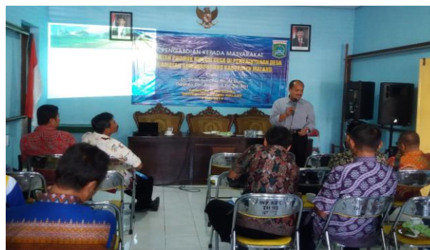
Gambar 4. Sesi Tanya-jawab peserta dengan pemateri.