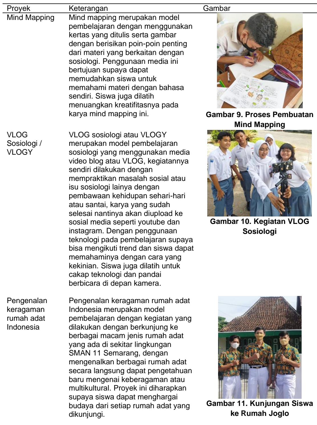
Gambar 9. Proses Pembuatan Mind Mapping