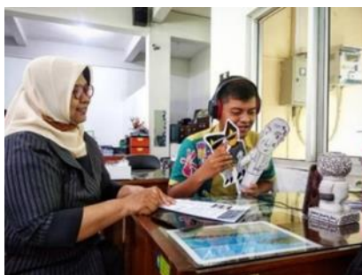
Gambar 2. Kondisi Pembelajaran Saat Pandemi

Pembelajaran praktikum juga berusaha dilakukan pada mata pelajaran sosiologi salah satunya dengan membuat wayang sosiologi secara mandiri di rumah dengan dipantau oleh guru selama 2 minggu untuk melihat progres proyek tersebut, pada saat presentasi karya yang sudah dibuat siswa ternyata jalan akan tetapi masih kurang maksimal karena terdapat kekurangan dalam pelaksanaannya karena tidak adanya tatap muka atau interaksi langsung antara siswa dan guru, sebab sebelum pembelajaran daring praktik seperti ini dilakukan di kelas dengan berkelompok dan juga dipresentasikan langsung dihadapan guru sehingga apabila terdapat kesalahan guru bisa membantu koreksi, terlebih lagi praktik yang dilakukan secara luring ini membutuhkan banyak tenaga, kreatifitas, dan public speaking yang dapat dilatih siswa yang hal tersebut tidak didapatkan saat pembelajaran daring.