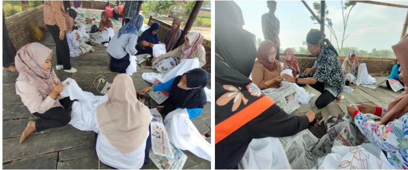
Gambar 3. Tahap Pencantingan

membuat motif batik (Yuliarti et al., 2022). Lilin malam dilelehkan menggunakan kompor listrik. Canting yang digunakan pada proses membuat batik ini terdiri dari beberapa ukuran yang disesuaikan dengan kebutuhan motif batik. Proses pencantingan ini memerlukan waktu yang cukup lama sekitar 1,5 jam. Hal tersebut dikarenakan peserta pelatihan pembuatan batik motif Refugia ini belum terbiasa dalam menggunakan canting. Gambar 3 menunjukkan proses pencantingan.