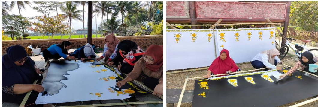
Gambar 4. Tahap Pewarnaan

Tahap kedua dalam pembuatan batik motif Refugia adalah proses pewarnaan, yang menggunakan pewarna bubuk remasol. Pewarna ini dicampur dengan air, dan tingkat kepekatan yang diinginkan ditentukan oleh jumlah air yang digunakan. Teknik pewarnaan yang diterapkan adalah teknik colet, yaitu dengan cara mengoleskan warna pada area yang diinginkan (Wardhani et al., 2023). Batik motif Refugia ini dominan menggunakan warna kuning dan hijau. Warna kuning melambangkan optimisme dan semangat dalam penciptaan motif ini, sementara warna hijau melambangkan kesuburan dan keberuntungan (Johari et al., 2022). Proses pewarnaan berlangsung sekitar 30 menit. Gambar 4 menunjukkan proses pewarnaan.