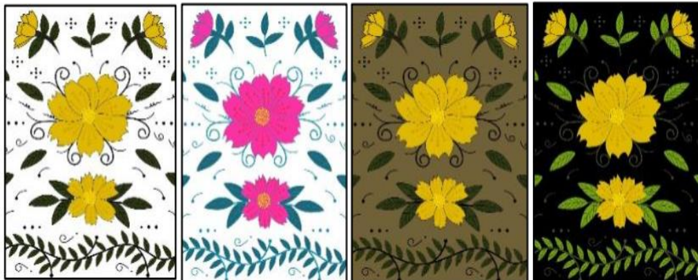
Gambar 2. Sketsa Gambar Motif Batik Manual

Setelah sketsa manual dan desain digital selesai dibuat maka dilakukan FGD ( Focus Group Discussion ) yang melibatkan pihak desa, ahli desain batik, serta para peserta pelatihan sebelum melakukan kegiatan membatik, tujuannya untuk mengetahui apakah motif batik Refugia tersebut sudah sesuai dengan hasil yang diinginkan. Hasil dari kegiatan FGD ( Focus Group Discussion ) menemukan bahwa harus dilakukan penyederhanaan motif batik karena, banyak dari peserta pelatihan merasa motif batik Refugia tersebut terlalu rumit jika dipraktikkan. Sehingga dilakukan penyederhanaan pada sketsa batik tersebut. Gambar 2 menunjukkan sketsa gambar motif batik manual.