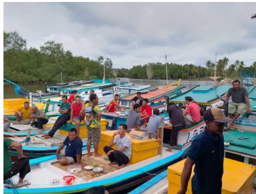
Gambar 1. Kegiatan Ma Baca Baca dalam Rangka Syukuran Kapal Baru di Desa Kurau

Komunikasi transedental ini sering terlihat dalam komunikasi antarbudaya Suku Bugis di Desa Kurau karena Suku Bugis sendiri adalah Suku yang memiliki pemahaman agama Islam yang kuat di Desa Kurau. seperti yang disampaikan Ellens (2014) bahwa Komunikasi transedental adalah proses yang melaluinya individu mengalami hubungan dengan Yang Ilahi, yang sering kali ditandai dengan rasa persatuan, kedamaian, dan pencerahan yang melampaui realitas biasa. Kebersamaan terasa erat apabila masyarakat Desa Kurau melakukan ritual adatnya. Misalnya saja kegiatan keagamaan seperti Ma Baca Baca dan Ma Barasanji (kegiatan syukuran/doa bersama masyarakat Suku Bugis) yang mana banyak mengundang warga sekitar untuk datang (Gambar 1).