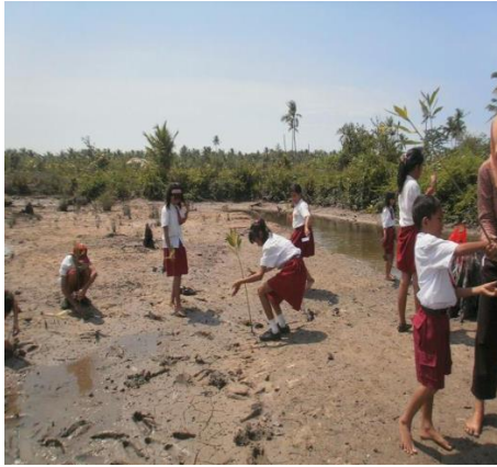
Gambar 2. Sosialisasi Konservasi Mangrove kepada Siswa SD di Desa Kurau

dapat melibatkan berbagai bentuk dan media komunikasi, seperti sosialisasi langsung ke SD dan ke pejabat pemerintahan serta mampu memunculkan publikasi di media cetak dan media online. Komunikasi ini harus disesuaikan dengan audiens yang berbeda dan menggunakan alat yang paling efektif untuk mencapai tujuan. Fleksibilitas dan adaptasi inilah yang menunjukkan bahwa komunikasi adalah konsep yang terbuka. Gambar 2 menunjukkan sosialisasi konservasi mangrove kepada siswa SD di Desa Kurau.