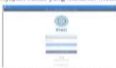
Gambar 1. Login di akun Prezi

Media berikutnya jauh lebih sederhana dari pada media MS Power Point dalam pembuatan animasi dan tautan. Seluruh kontennya mempermudah pengguna untuk menghasilkan penyajian bahan yang menarik. Media tersebut adalah Prezi .