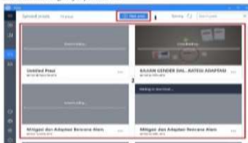
Gambar 2. Jendela utama Prezi

Prezi mengharuskan pengguna untuk mendaftar secara online menggunakan surel. Setelahnya pengguna bisa menggunakannya secara offline. Jika Anda terputus dengan internet maka prezi yang tersedia bisa Anda unduh dan Anda gunakan sesuai dengan ijin pemilik file.