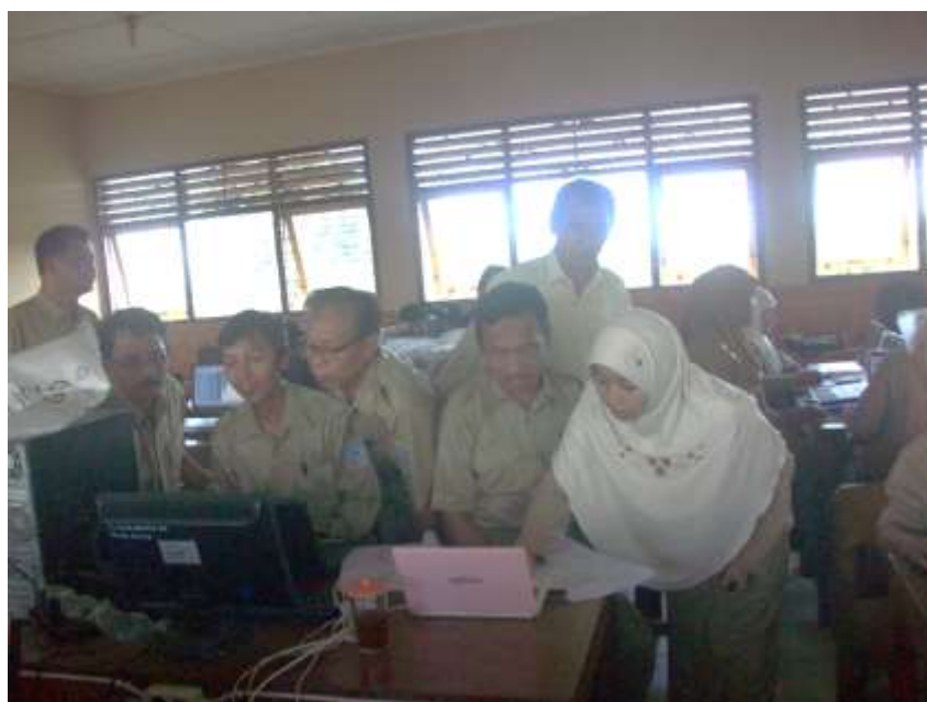
Gambar 3. Guru yang mempraktekkan materi yang sudah didapatkan

Pelaksanaan pengabdian berlangsung pada hari senin-selasa tanggal 15-16 Mei 2017 dengan jadwal dari pukul 13.00-16.00 WIB. Peserta yang ikut kegiatan pelatihan ini sebanyak 26 Guru SMP N 2 Dampit. Kegiatan ini berupa penyampaian materi dan praktek langsung untuk penggunaan media pembelajaran menggunakan MS Power Point , FlipBook Maker , dan Prezi . Terdapat 4 mahasiswa yang membantu pelaksanaannya sebagai pendamping kelompok kecil yang beranggotakan 6-7 orang. Setiap kelompok langsung mempraktikkan cara penggunaan media setelah mendapatkan materi oleh tim instruktur.