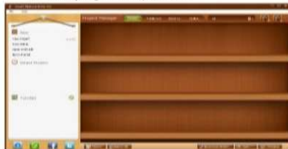
Gambar 1. Gambar perangkat lunak FLipBook Maker

Pertama buka perangkat lunak FlipBook Maker