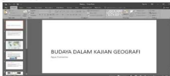
Gambar 1. File MS Power Point Budaya dalam Kajian Geografi

Bapak Ibu guru dapat menggunakan file MS Power Point yang sudah dibuat sebelumnya untuk membuat media ini atau membuat file yang baru. Setelah file konten telah siap dan disusun sesuai dengan urutan penyajiannya maka barulah tautan dapat diatur. Misal file yang tersaji memiliki 10 lembar dengan isi teks, gambar, dan diagram.