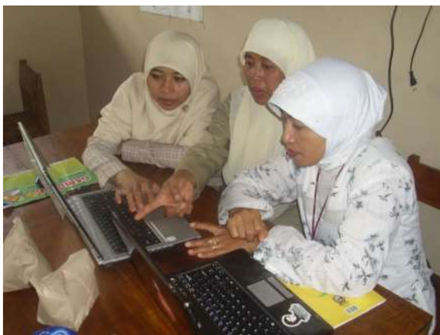
Gambar 4. Guru yang mempraktekkan materi yang sudah didapatkan

Faktor yang mendukung terlaksananya kegiatan pengabdian pada masyarakat ini adalah besarnya minat dan antusiasme peserta selama kegiatan, sehingga kegiatan berlangsung dengan lancar dan efektif. Sedangkan faktor penghambatnya adalah keterbatasan waktu serta masih kurangnya fasilitas berupa jaringan internet. Pihak sekolah sudah mengupayakan kepada pihak desa setempat namun masih belum mendapatkan tanggapan.