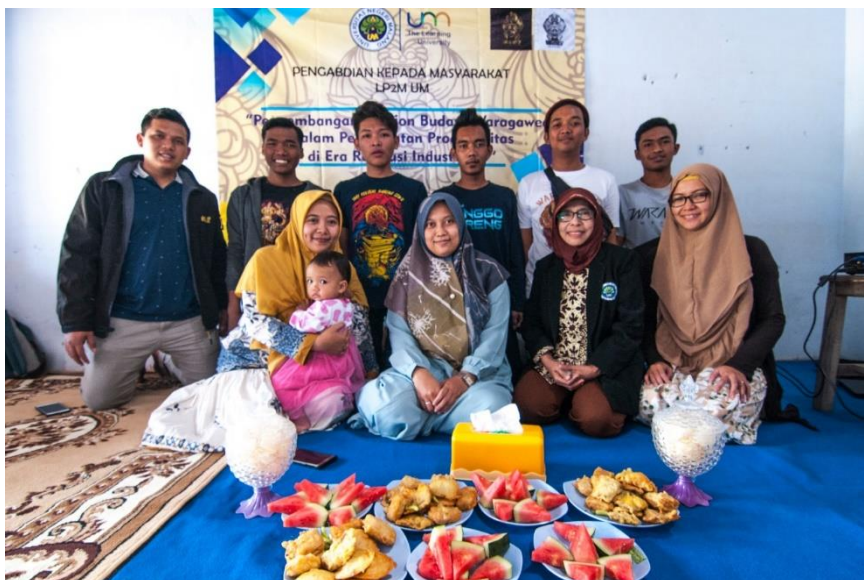
Gambar 1. Kegiatan Pelatihan pengelolaan keuangan dan pemasaran online

Kegiatan pelatihan ditentukan tanggal 12 Juli 2019, materi pada pelatihan ini adalah mengenai bagaimana pemasaran online yang efektif dan branding terhadap usaha Waraga wear ini. Hal yang sudah dilakukan oleh waraga wear adalah memasarkan produknya melalui Instragam, kemudian bersama tim pengabdian menganalisis kekurangan dan kelebihan pemasaran melalui Instragam ini. Hal yang kemudian dilakukan adalah dengan menambah pemasaran online dengan dibuatkannya website www.waragawear.com . Selain memberikan pelatihan bagaimana pemasaran online yang efektif, tim pengabdian juga melakukan pelatihan bagaimana mengenai pengelolaan keuangan yang baik untuk usaha ini. Memberikan ilmu bagaimana memisahkan harta usaha dengan harta pribadi, sehingga modal usaha, keuntungan dan uang pribadi tidak tercampur. Dengan menguasai teknik pengelolaan keuangan yang baik diharapkan mitra dapat mengetahui sejauh mana keuntungan atau kerugian yang didapatkan sehingga dapat dilakukan koreksi terhadap posisi keuangan usaha. Selain 2 hal diatas tim pengabdian juga memberikan saran-saran terhadap pemilihan mitra produksi, mulai dari pemilihan bahan, sablon hingga pengemasan. Saran untuk pengelolaan manajemen usaha agar usaha waraga wear ini lebih tahan banting di dunia usaha dan mempersiapkan ketika ada kompetitor yang masuk pada usaha sejenis.