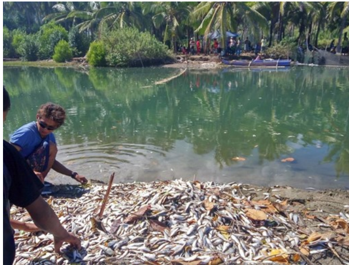
Gambar 2. Ikan Sarden ( juku' lompa )

Tradisi Anjala Ombong dilaksanakan di Desa Harapan Kecamatan Bontosikuyu. Arti Anjala Ombong adalah menangkap ikan menggunakan jaring secara beramai-ramai. Ikan yang menjadi tangkapan adalah jenis ikan tertentu yaitu ikan sarden yang dalam bahasa selayar disebut juku' lompa . Juku' lompa di muara sungai sangkulu-kulu memiliki musim dimana jenis ikan ini akan memasuki muara sungai. Juku' lompa akan banyak muncul pada bulan Juli dan Agustus, sehingga merupakan bulan yang ideal untuk pelaksanaan Anjala Ombong . Penampakan Juku' lompa ditunjukkan pada Gambar 2.