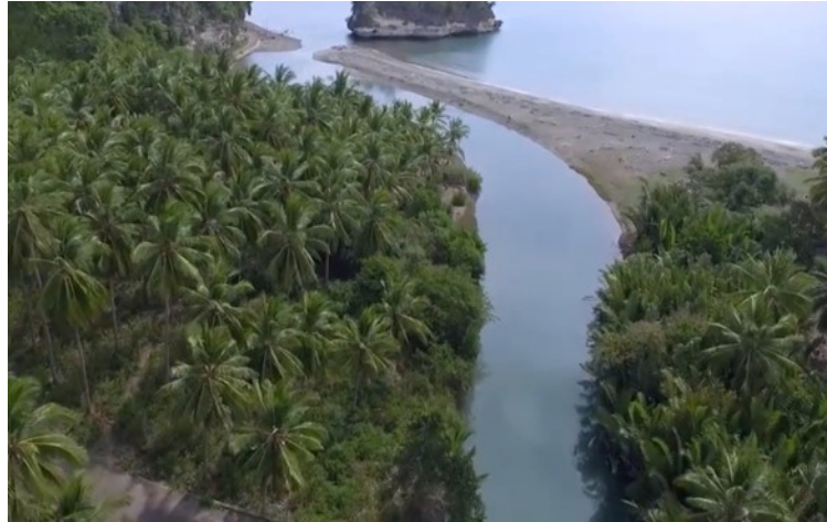
Gambar 3. Muara Sungai Sangkulu–kulu

Salinitas yang didapatkan dari observasi lapangan di Muara Sungai Sangkulu–kulu adalah 22‰. Meskipun juku' lompa menyukai lingkungan hidup dengan kandungan salinitas tinggi, akan tetapi karena telah terbiasa hidup di lingkungan pesisir pantai, sehingga relatif toleran terhadap salinitas rendah (20‰). Salinitas yang dimiliki oleh Muara Sungai Sangkulu–kulu pada bulan Juli–Agustus yaitu 22‰ membuat juku' lompa bergerombol memasuki Muara Sungai ini. Ikan Sarden mampu hidup pada kedalaman 0–50 m. Kedalaman rata–rata Muara Sungai Sangkulu–kulu adalah 1.2 m, termasuk dalam kategori perairan dangkal. Sehingga juku' lompa mampu hidup pada muara sungai ini.