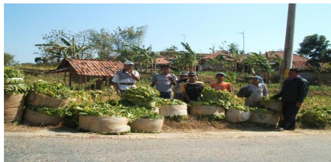
Gambar 2. Produktivitas Tembakau di Desa Pemaron

Penambahan modal oleh petani tembakau di Desa Pemaron paling besar adalah pada interval 50 juta sampai dengan 100 juta oleh 27% petani. Penambahan modal di Desa Pemaron berasal dari berbagai sumber yaitu dari bank dan pribadi. Sumber penambahan modal di Desa Pemaron sebanyak 23% berasal dari bank dan sebanyak 4% berasal dari pribadi. Responden lebih memilih melakukan pinjaman di bank dikarenakan bunga di bank lebih rendah dari pada meminjam di pribadi atau rentenir. Selain itu proses peminjaman di bank juga lebih mudah asalkan responden memiliki jaminan. Sebanyak 27% responden di Desa Pemaron memiliki lahan pertanian seluas kurang dari 4 Ha. Responden di Desa Pemaron sebanyak 27% status lahannya sewa. Biaya untuk menyewa lahan yaitu Rp 125.000 untuk 1 are. Responden lebih memilih menyewa lahan karena lahan yang dimiliki responden tidak cukup untuk pertanian tembakau. Keuntungan yang dapat diperoleh responden selama satu kali musim tanam tembakau yaitu sekitar 20-40 juta per 2 Ha. Produktivitas tembakau di Desa Pemaron sebanyak 26% menghasilkan tembakau 2000-6000 Kg/Ha.