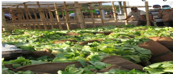
Gambar 1. Produktivitas Tembakau di Desa Panji

Produktivitas tembakau yang dihasilkan petani di Desa Panji paling besar atau sebanyak 61% petani menghasilkan 2000 sampai dengan 6000 Kg/Ha, sebanyak 11% petani menghasilkan lebih dari 8000 Kg/Ha dan yang paling sedikit atau sebanyak 2% petani menghasilkan 6000 sampai dengan 8000 Kg/Ha. Kondisi ini menunjukkan bahwa produktivitas pertanian tembakau secara kuantitas masih tergolong rendah.