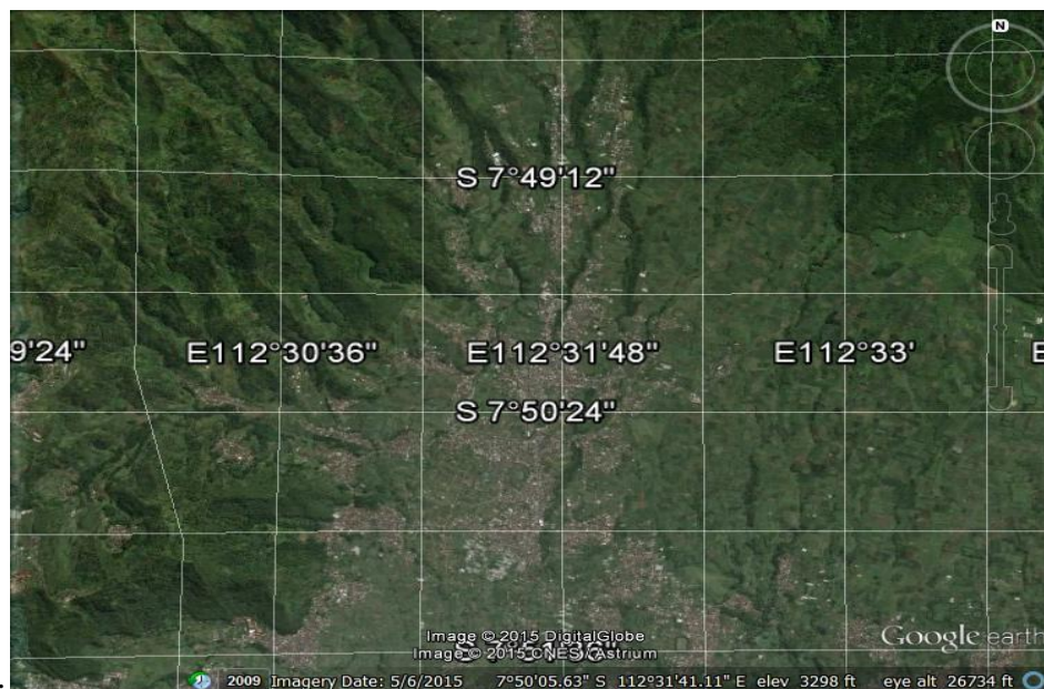
Gambar 3. Citra I - Liputan citra Google-Earth daerah Tulungrejo Bumiaji Batu

Adapun bentuk erosi permukaan yang dapat diinterpretasi adalah sebagai berikut: 1) Kenampakan erosi parit ( Gully Erosion ), erosi parit adalah bentuk-bentuk erosi tanah yang mempunyai kedalaman maksimum 0,5 meter. Kedalaman 0,5 meter ini akan terdeteksi bayangannya pada citra google earth skala 1:20.000. Erosi parit dideteksi keberadaannya dari bayangan tebing paritnya yaitu kenampakan dengan rona gelap memanjang (Lihat pada gambar 4.3. pojok kiri bawah). 2) Kenampakan erosi alur (Rill erosion), erosi alur adalah alur-alur erosi yang terbentuk oleh aliran alir. Alur ini akan hilang apabila tanah dibajak untuk penyiapan lahan. Pada citra Google Earth dengan skala 1:1.000 pola alur masih bisa terdeteksi (Lihat Citra 2 pada Titik No 2). Jarak 0,5 meter akan tergambar pada citra itu sejauh 0,5 milimeter. Jikalau itu jarak vertikal (kedalaman alur) akan sangat sulit