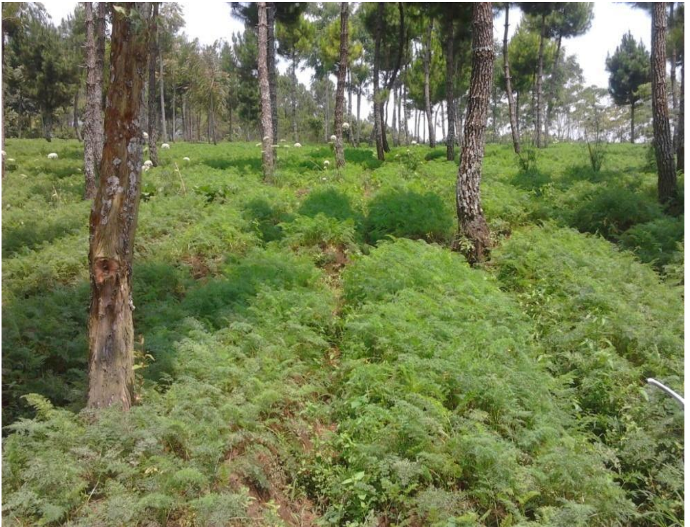
Gambar 7. Kenampakan erosi alur pada lahan hutan