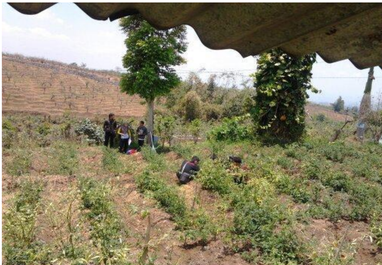
Gambar 6. Kenampakan erosi alur