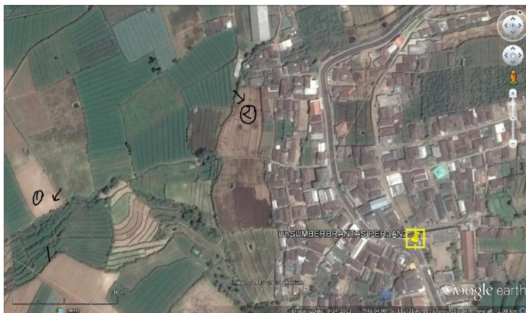
Gambar 4. Citra II- Sumber Brantas Tulungrejo