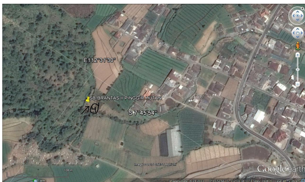
Gambar 5. Citra III- Sumberbrantas