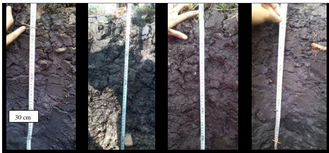
Gambar 4.1 Profil Tanah Vertisol

Keterangan: st = sangat teguh, bs = berbuih sedikit, bb = berbuih banyak