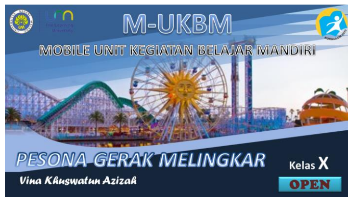
Gambar 1. Halaman Sampul M-UKBM

Halaman “Menu Utama” berisikan 8 menu-menu yang ada dalam M-UKBM antara lain: menu cover M-UKBM, identitas M-UKBM, petunjuk M-UKBM, review, kegiatan belajar, ulasan materi, latihan soal resitasi, biodata penyusun. Halaman menu utama dapat dilihat pada Gambar 2.