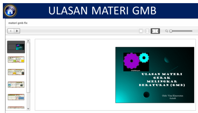
Gambar 4. Ulasan Materi