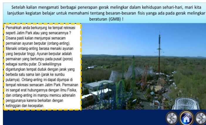
Gambar 3. Salah Satu Halaman Bagian Kegiatan Belajar

Ulasan materi berisi ringkasan dan pembahasan materi secara singkat gerak melingkar beraturan yang berbentuk e-book interaktif dari aplikasi I-spring . Dapat dilihat pada Gambar 4. Latihan soal resitasi berisi latihan soal-soal materi GMB yang disertai umpan balik dan kunci jawaban. Latihan soal berbasis resitasi ini menggunakan prinsip tidak dapat melanjutkan ke latihan soal berikutnya jika masih salah dalam menjawab pada soal sebelumnya, jika telah berhasil menjawab jawaban yang benar maka dapat dilanjutkan ke latihan soal berikutnya. Umpan balik bertujuan memberi petunjuk pembenaran jika siswa menjawab jawaban yang salah, atau berisi pujian dan penguatan materi jika siswa menjawab jawaban yang benar. Sedangkan kunci jawaban berisikan pembahasan soal agar siswa mengetahui pembahasan soal yang benar.