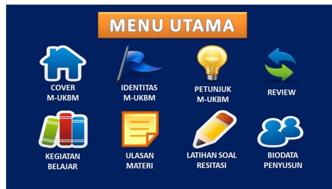
Gambar 2. Menu Utama M-UKBM