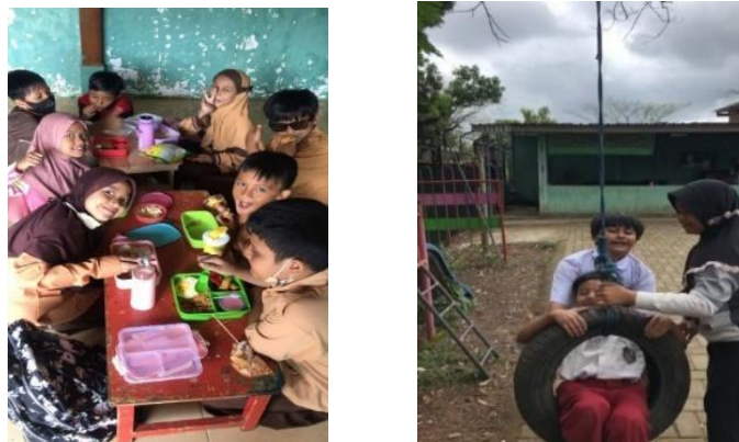
Gambar 3 Contoh kegiatan emosional yang menekankan pada sikap sosial