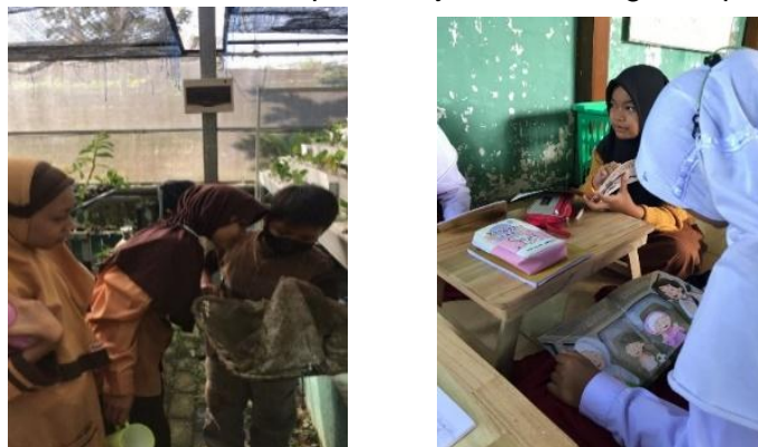
Gambar 2 Pemanfaatan media pembelajaran saat kegiatan pembelajaran