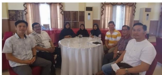
Gambar 2 Wawancara dengan Kepala MATAKUN

Beragama merupakan hak yang melekat bagi setiap orang (HAM), sehingga pemerintah berencana untuk membangun perguruan tinggi ini. Dipilihnya Bangka Belitung dikarenakan memiliki masyarakat yang tingkat toleransi tinggi. Hal ini dilihat dari keharmonisan antara umat Melayu dan Cina yang sangat kental selaras dengan semboyan “Tong Ngin Fan Ngin Jit Jong” yang artinya Melayu dan China sama saja. Kemudian pemerintah pusat meminta Matakun Bangka Belitung untuk menyiapkan lahan pembangunannya dan hibah lahan tersebut berada di Bangka Tengah (Wawancara Kepala Matakun, 2023).