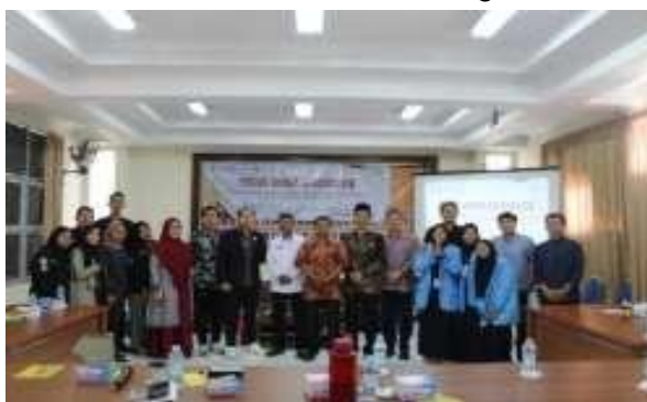
Gambar 4 Foto bersama setelah kegiatan FGD

Selanjutnya, pembangunan ini dikhawatirkan dapat mengganggu sendi-sendi keharmonisan masyarakat melayu china yang telah hidup berdamping dengan baik. Hal ini disampaikan oleh Kepala desa Batu Belubang dalam Focus Group Discussion yang diselenggarakan oleh peneliti dengan menghadirkan beberapa pihak terkait pada tanggal 15 September 2023.