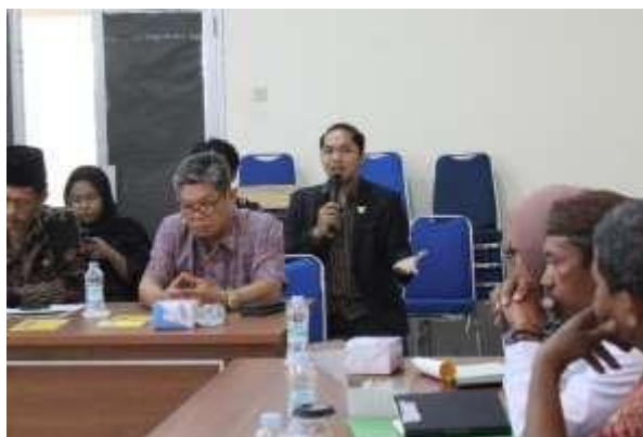
Gambar 3 Kegiatan FGD

UUD Negara Republik Indonesia pada Rumusan Pasal 28C ayat (1) menyatakan bahwa “ setiap orang berhak mengembangkan diri melalui pemenuhan kebutuhan dasarnya, berhak mendapat Pendidikan dan memperoleh manfaat dari ilmu pengetahuan dan teknologi, seni dan budaya, demi meningkatkan kualitas hidupnya dan demi kesejahteraan umat manusia ”. Oleh karenanya guru agama Konghucu yang berlatar belakang Strata 1 menjadi kebutuhan supaya ajaran agama Konghucu tidak hanya bisa dipelajari di sekolah akan tetapi bisa juga diimplementasikan dalam kehidupan sehari-hari. Gubernur BEM KM FH UBB 2023 (Yos) mengatakan bahwa keberagaman di Bangka Belitung menggambarkan kebersamaan. Pernyataan ini disampaikan dalam kegiatan FGD pada tanggal 15 September 2023.