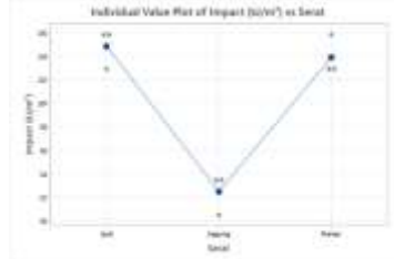
Gambar 4 Individual Value Plot ketangguhan impact komposit serat alam.

Berdasarkan hasil perhitungan statistik (Tabel ANOVA), diperoleh nilai F-value sebesar 49,19 dengan P-value 0,000. Karena nilai P lebih kecil dari tingkat signifikansi yang umum digunakan ( \alpha = 0,05 ), maka dapat disimpulkan bahwa terdapat perbedaan yang signifikan secara statistik antara nilai ketangguhan impact ketiga jenis serat. Hasil ini mendukung hipotesis awal penelitian bahwa perbedaan jenis serat alam memberikan pengaruh nyata terhadap sifat mekanik komposit, khususnya ketangguhan impact. Selain itu untuk memperjelas perbedaan antar kelompok, digunakan grafik Individual Value Plot yang menggambarkan distribusi nilai impact setiap jenis serat. Grafik ini ditunjukkan pada Gambar 4.