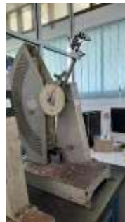
Gambar 1 Mesin uji impact model GT-7045 di Laboratorium Material Politeknik Manufaktur Negeri Bangka Belitung.

Dengan demikian, pemilihan ketiga jenis serat ini menggabungkan prinsip keberlanjutan, potensi lokal, dan ekspektasi performa mekanik yang memadai, sehingga mendasari pengembangan material alternatif penguat komposit untuk aplikasi energi terbarukan seperti bilah turbin angin.