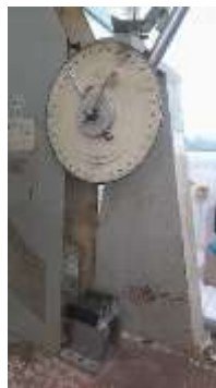
Gambar 2 Dokumentasi pengujian impact menggunakan mesin GT-7045

Secara umum, perbedaan ketangguhan impact yang dihasilkan oleh tiga jenis serat ini sejalan dengan temuan berbagai penelitian terdahulu, yang menyebutkan bahwa sifat mekanik komposit sangat dipengaruhi oleh jenis dan karakteristik serat penguat [6], [9], [19]. Serat dengan kandungan selulosa tinggi dan struktur serat yang padat umumnya memberikan ketangguhan impact yang lebih besar dibandingkan serat dengan struktur rapuh. Temuan ini mengindikasikan bahwa serat ijuk dan nanas berpotensi lebih besar untuk diaplikasikan pada komponen struktural ringan, seperti bilah turbin angin skala kecil dan menengah, sedangkan serat jagung lebih cocok untuk aplikasi non-struktural. Untuk memperoleh pemahaman yang lebih mendalam terhadap perbedaan ketangguhan impact dari ketiga jenis serat alam yang digunakan (ijuk, daun nanas, dan daun jagung), dilakukan uji statistik One-Way ANOVA menggunakan perangkat lunak Minitab. Tujuan dari analisis ini adalah untuk menguji hipotesis apakah terdapat perbedaan signifikan antara rata-rata kekuatan impact dari ketiga jenis serat tersebut. Metode ini dipilih karena sesuai untuk membandingkan rata-rata dari lebih dari dua kelompok perlakuan pada satu variabel respon, yaitu ketangguhan impact komposit. Hasil perhitungan One-Way ANOVA menggunakan aplikasi minitab dapat dilihat pada gambar 3.