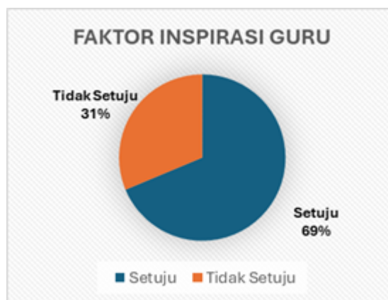
Gambar 7. Faktor Guru yang Menjadi Inspirasi Mahasiswa PTO

Sebanyak 75% responden setuju bahwa guru adalah pekerjaan yang mulia hal tersebut atas dasar teori yang dijelaskan oleh Hurlock (2010:145) bahwa salah satu indikasi seseorang memilih pekerjaan adalah dengan status sosial pekerjaanya.