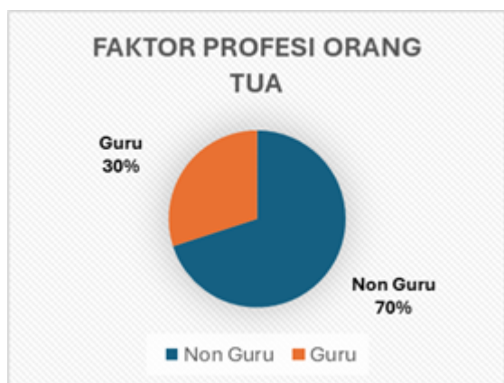
Gambar 5. Faktor Profesi Orang Tua

Menurut hasil penelitian yang telah dilakukan sebanyak 70,3% responden menjawab bahwa mereka bukan berasal dari keluarga yang orang tuanya berprofesi sebagai guru, ini menjadi hal yang penting karena bimbingan dan pendidikan seorang anak akan didapat pertama kalinya dalam lingkungan keluarga (Hasbullah, 2009:38), indikasinya bahwa seseorang yang berminat menjadi guru tidak harus berasal dari latar belakang keluarga yang berprofesi sebagai seorang guru juga.