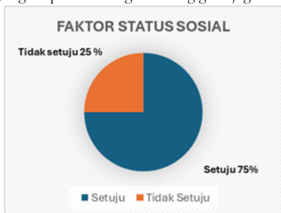
Gambar 6. Faktor Status Sosial Guru Menurut Mahasiswa PTO

Menurut hasil penelitian yang telah dilakukan sebanyak 70,3% responden menjawab bahwa mereka bukan berasal dari keluarga yang orang tuanya berprofesi sebagai guru, ini menjadi hal yang penting karena bimbingan dan pendidikan seorang anak akan didapat pertama kalinya dalam lingkungan keluarga (Hasbullah, 2009:38), indikasinya bahwa seseorang yang berminat menjadi guru tidak harus berasal dari latar belakang keluarga yang berprofesi sebagai seorang guru juga.