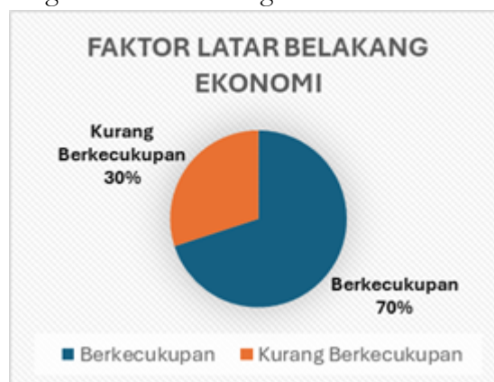
Gambar 4. Faktor Latar Belakang Ekonomi Mahasiswa PTO

Pada hasil penelitan yang telah dilakukan menunjukkan bahwa sebanyak 65% mahasiswa menjawab taat dengan artian mahasiswa pendidikan teknik otomotif sebagian besar taat beragama.