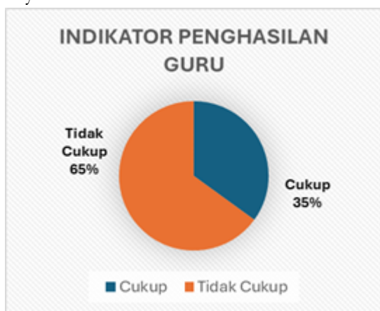
Gambar 2. Kecukupan Penghasilan Guru Menurut Responden

Pada hasil penelitian pun di dapatkan hasil beberapa indikator atau faktor mengapa mahasiswa aktif pendidikan teknik otomotif berminat atau tidaknya menjadi seorang guru, menurut Suryono & Hariyanto (2015:180) faktor terpengaruhnya minat adalah internal dan eksternal, maka dengan itu indikator tersebut diantaranya yaitu faktor penghasilan seorang guru di mata mahasiswa pendidikan teknik otomotif, faktor agama atau panggilan jiwa untuk menjadi seorang guru, faktor latar belakang ekonomi keluarga, faktor latar belakang profesi orang tua mahasiswa, faktor sosial atau faktor yang berkaitan dengan masyarakat luas.