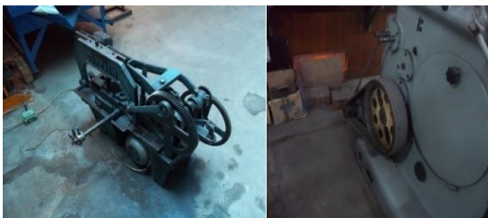
Gambar 1. Mesin tanpa cover pengaman. (foto diambil 2 oktober 2013)

Dari hasil penelitian, beberapa mesin ditemukan tanpa cover pengaman yang ditunjukkan pada gambar 1. Mesin tanpa cover pengaman diantaranya yaitu mesin gergaji logam dan mesin. Kondisi tersebut dapat menimbulkan bahaya kecelakaan. Menurut Kustono (1999:19) hal-hal yang dapat menimbulkan bahaya kecelakaan dari pemakaian pesawat tenaga dan produksi antara lain: roda gigi yang terbuka, ban penggerak dan poros transmisi tanpa alat pelindung, dan lain sebagainya.