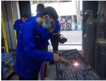
Gambar 4 Mahasiswa tidak menggunakan kacamata las pada saat mengelas. (foto diambil 2 Oktober 2013)