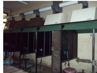
Gambar 5. Ventilasi buatan pada laboratorium pengelasan (foto diambil 16 april 2015)

Ventilasi buatan pada laboratorium pengelasan berfungsi sebagai penghisap udara yang mengandung debu, gas, dan asap las.