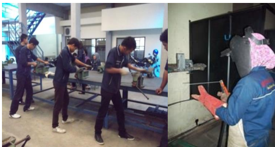
Gambar 3. (a) Mahasiswa pada saat praktik kerja bangku. (b) mahasiswa pada saat praktik pengelasan (foto diambil 30 September 2013)

Menyampaikan pengantar K3 pada awal praktik penting untuk dilakukan. Pada saat praktik mahasiswa harus paham dengan alat yang akan di pinjam dan alat yang di pakai. Hal ini sudah dilakukan oleh dosen yang mengajar mata kuliah praktik. Selain itu memasukkan aspek K3 dalam penilaian hasil belajar mahasiswa penting agar mahasiswa membiasakan diri bekerja aman. Sebagian dosen memasukkan aspek K3 dalam penilaian hasil belajar, dan masih ada dosen yang tidak memasukkan aspek K3 dalam penilaian hasil belajar.