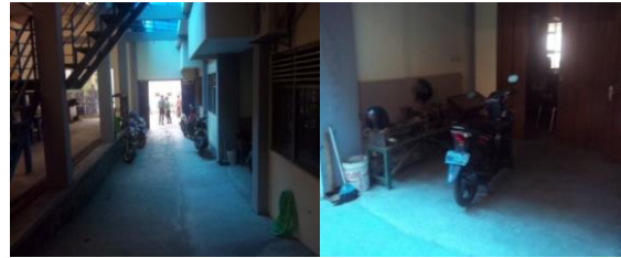
Gambar 2. Kondisi Lorong Laboratorium (foto diambil 2 oktober 2013)

Dari hasil penelitian bahwa kondisi lorong pada laboratorium menjadi tempat parkir sepeda motor, selain itu ditemukan juga sepeda motor yang parkir di depan pintu Laboratorium Pemesinan. Menurut Daryanto (2010:10) semua jalan atau gang, jalan keluar, dan jalan darurat kebakaran harus terbebas dari kerusakan atau hambatan.