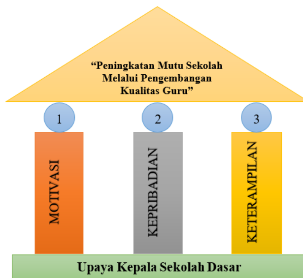
Gambar 1. Diagram Skema Pemikiran Pengembangan Kualitas Guru dalam Upaya Meningkatkan Mutu Sekolah Dasar

pemimpin maka guru tidak akan dapat menghasilkan lulusan yang berkualitas. Oleh karena itu, perlunya upaya dalam pengembangan kualitas guru melalui tiga indikator tersebut.