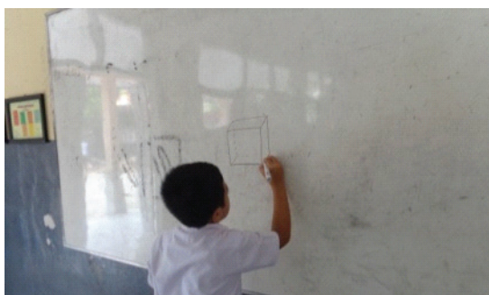
Gambar 3. Kegiatan siswa saat menggambar bangun ruang

Peneliti membimbing dan mengarahkan siswa pada saat pengerjaan LKS kepada setiap kelompok, dengan tujuan agar tetap kondusif. Setelah selesai, peneliti mengulas dan meluruskan