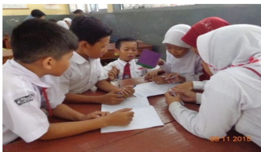
Gambar 2. Pengerjaan LKS secara berkelompok

Ketiga , Pengembangan pemahaman konsep balok dan kubus melalui gambar. Pada bagian ini, pembelajaran dilanjutkan dengan melihat gambar yang telah tersedia di papan tulis. Siswa melihat bentuk bangun ruang kubus dalam bentuk gambar. Disini perlu ditekankan bahwa kubus itu sisinya berbentuk persegi dan bukan gambarnya yang persegi. Hal tersebut berdasarkan antisipasi masih adanya siswa yang memahami bahwa kubus itu persegi. Kegiatan ini menemukan siswa mengenal bentuk persegi dengan sebutan persegi empat. Peneliti mencoba meluruskan bahwa sisinya itu persegi bukan persegi empat. Selanjutnya, siswa dibentuk kedalam tujuh kelompok. Dalam pembentukannya terjadi kegaduhan, karena ada kesalahan ketika proses pembagiannya. Setelah itu, kegiatan pembelajaran dapat dikendalikan kembali. Setiap kelompok diberi LKS. Siswa saling bekerjasama dalam proses pengerjaannya.