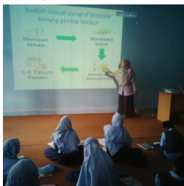
Gambar 5. Scene-setting dengan Strategi Presentasi

si tersebut ditemukan penulis pada proses perencanaan pembelajaran berupa penyusunan instrumen pembelajaran antarguru bahasa Indonesia dan konsultasi instrumen pembelajaran antara guru bahasa Indonesia kelas IV dan V dengan HOD of Languages . Sedangkan strategi pembelajaran berbasis presentasi, pada penelitian ini ditemukan pada pembelajaran di kelas V pada saat scene setting terkait jenis-jenis karangan.