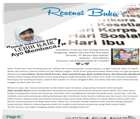
Gambar 4. Hasil Karya Tulisan Siswa pada Buletin Sekolah

Sedangkan strategi penerbitan diaplikasikan oleh guru pada proyek tahunan siswa dalam rangka penulisan artikel buletin sekolah dan majalah dinding.