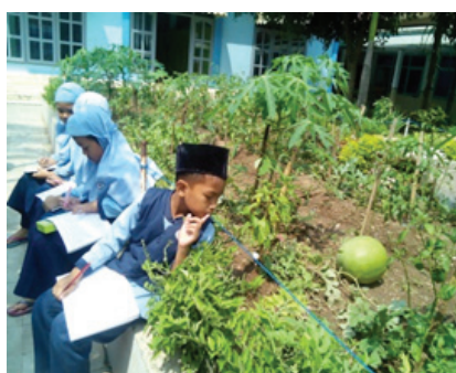
Gambar 6. Strategi Kunjungan atau Visitasi

Strategi pembelajaran kooperatif tampak pada beberapa pengamatan yang dilakukan oleh peneliti pada proses pembelajaran. Strategi terakhir adalah inviting speakers atau menghadirkan tokoh. Pada penelitian ini, peneliti tidak menemukan penerapan strategi tersebut. Namun, temuan peneliti adalah adanya penerapan strategi pembelajaran visitasi atau kunjungan. Pada strategi kunjungan yang teramati oleh peneliti, siswa melakukan kunjungan ke kebun sekolah guna pengamatan terhadap tumbuh-tumbuhan dan situasi serta kondisi kebun sekolah.