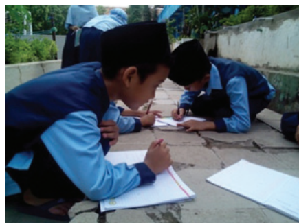
Gambar 3. Strategi Jurnal Penulisan

Sementara itu, strategi penyusunan jurnal penulisan digunakan pada pembelajaran menulis karangan di kelas IV serta pada materi penulisan laporan hasil kunjungan di kelas V.