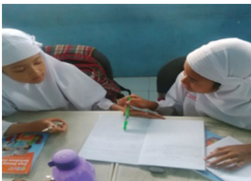
Gambar 2. Strategi Tukar Pikiran & Peer Checking

Berkesuaian dengan hasil penelitian tersebut, penyusunan materi pembelajaran menulis oleh guru bahasa Indonesia di SD IIS PSM, ketiga jenis strategi tersebut dimasukkan ke dalam rencana pembelajaran. Berdasarkan hasil temuan peneliti, strategi tukar pikiran diterapkan oleh guru pada bagian scene-setting penulisan kerangka karangan dan di bagian poses penulisan pada saat peer-checking hasil karya tulisan siswa.