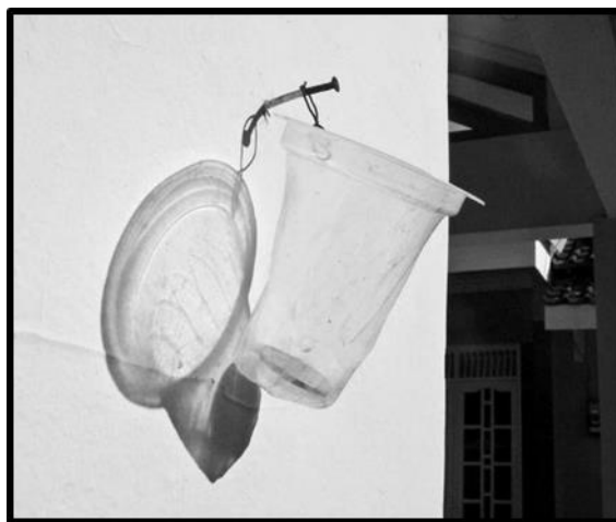
Gambar 1. Ilustrasi Wadah Tempat Meletakkan Jimpitan di Setiap Rumah

Dikutip dari Arianti dkk (2013), Jimpitan merupakan kegiatan gotong-royong yang dilaksanakan dalam upaya untuk membantu memecahkan masalah keterbatasan dana untuk pembangunan di suatu lingkungan. Kegiatan Jimpitan ini dilakukan secara sukarela, tidak ada paksaan atau sanksi yang diberikan kepada warga yang tidak mengikuti kegiatan ini. Di beberapa daerah, Jimpitan berupa beras masih dilakukan sampai saat ini. Namun, di beberapa daerah lainnya, peran beras dalam kegiatan Jimpitan ini perlahan mulai dialihfungsikan menjadi uang, tanpa mengurangi dan mengubah nilai dan fungsi dari kegiatan Jimpitan ini (Bagaskara, 2017).