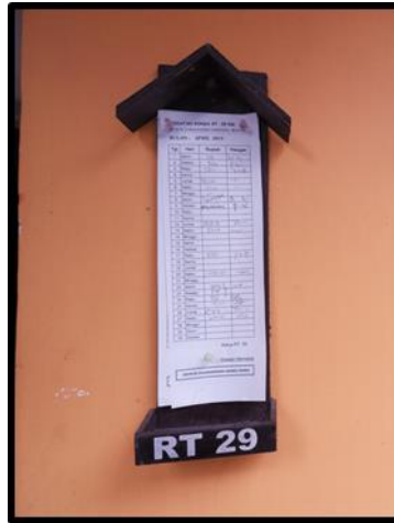
Gambar 2. Laporan Kalkulasi Jumlah Uang atau Beras Hasil Jimpitan di Pos Kamling

Kegiatan Jimpitan tidak dapat dilepaskan dari kegiatan ronda. Berdasarkan Kamus Besar Bahasa Indonesia (KBBI), ronda adalah berjalan berkeliling untuk menjaga keamanan atau biasa disebut dengan berpatroli. Biasanya kegiatan ini dilakukan secara berkelompok oleh masyarakat di suatu lingkungan. Dikutip dari Suroso (2012), di daerah Bragasan, masyarakat yang tergabung dalam kelompok ronda ini akan datang ke pos kamling, tempat berkumpulnya masyarakat yang ingin melaksanakan ronda, sekitar pukul 22.00 WIB. Lalu mereka akan menetap di pos kamling hingga pukul 1.30 WIB. Setelah tiba pukul 1.30 WIB, kelompok ronda ini akan dibagi menjadi 2 kelompok, yaitu kelompok yang bertugas untuk menjaga pos kamling dan kelompok yang bertugas untuk patroli dari rumah ke rumah. Ketika sedang melakukan patrol dari rumah ke rumah, kelompok ini akan mengambil beras koin Jimpitan dari setiap rumah. Setelah semua beras koin Jimpitan dari setiap rumah terkumpul, kelompok yang berpatroli dari rumah ke rumah akan kembali ke pos kamling.