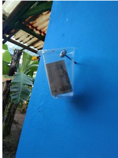
Gambar 4. Wadah dan uang jimpitan di Desa Pesantren Rt04/02

itu, sama seperti kasus pengangguran, kegiatan jimpitan bisa digunakan untuk mengumpulkan dana sosial untuk membantu warga penderita Covid-19 yang menjalani isolasi mandiri.