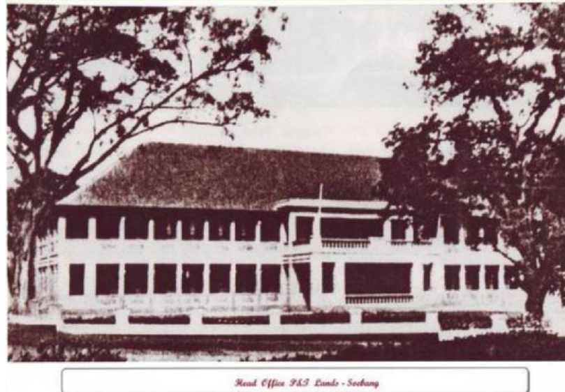
Gambar 3. Kantor Pusat P &T Lands tahun 1939

Setelah pengambilalihan tanah oleh Pemerintah Hindia Belanda, perusahaan perkebunan P&T Lands tetap fokus untuk membangun perkebunan. Menurut keterangan W. H. Daukes yang merupakan ketua dan Direktur Pelaksana The Anglo-Dutch Plantations of Java Ltd. , antara tahun 1922 sampai 1923, telah dibeli sebanyak 16 buah perkebunan dengan luas 16.800 hektar. Dari luas tanah itu terdapat 15 buah dengan luas 14.000 hektar yang terletak di atas tanah erfpacht dan sebuah perkebunan di atas tanah konsesi kesultanan yang luasnya mencapai 2.800 hektar. Kepemilikan tanah ini berlangsung hingga menjelang pecah Perang Dunia II atau masuknya Jepang ke tanah Jawa. Kemudian P&T Lands diserahkan kepada Jepang pada tanggal 8 Maret 1942 di Kalijati. Ketika pendudukan Jepang, terjadi beberapa perubahan di P&T Lands . Perusahaan mengalami banyak kerugian dan banyak perkebunan yang dibongkar. Bahkan salah satu perusahaan padi “Sukanagara” terhenti karena tak mampu berproduksi. Banyak tanaman mengalami kerusakan, bahkan tahun 1940 sebanyak 10.669.00 kg tanaman teh mengalami kekeringan. Tidak hanya teh dan padi, jumlah tanaman karet dan sisal yang diekspor ke Eropa pun menurun. Banyak kebun yang menjadi padang alang-alang yang tidak terurus. Tanaman lainnya secara lambat-laun pun lenyap karena tidak diurus (Meinanda & Rudiono, 2008).