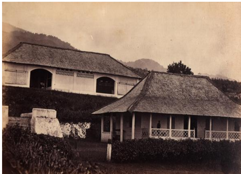
Gambar 2. Kantor dan Pabrik Kopi di Tenggeragung P&T Lands sekitar abad ke-19 dan ke-20.