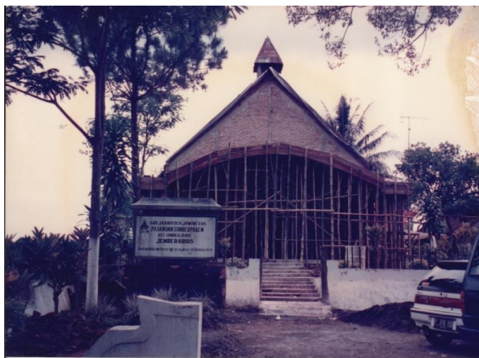
Gambar 2. Renovasi gereja tahun 1998

Gedung Gereja Kristen Jawi Wetan (GKJW) Sumberpakem pernah beberapa kali direnovasi, di antaranya pada tahun 1946, tahun 1963, 1988, dan renovasi total tahun 1998 ( Gambar 2 ), kemudian kembali direnovasi sampai sekarang. Tujuan diadakannya renovasi adalah untuk melakukan upgrade terhadap gereja. Hal itu berkenaan dengan semakin tuanya bangunan dan juga semakin banyaknya jumlah jemaat. Sehingga diperlukan penambahan beberapa sarana dan prasarana. Renovasi terhadap gereja memungkinkan untuk menampung lebih banyak jemaat dan juga merawat agar gereja masih bisa digunakan untuk di masa yang akan datang.