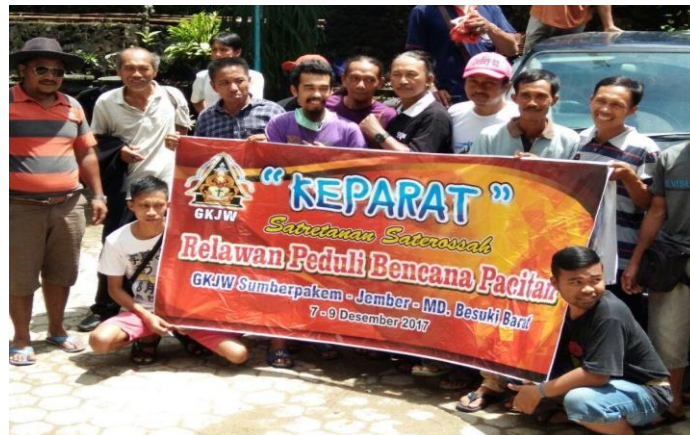
Gambar 4. Kegiatan Keparat

Jemaat GKJW Sumberpakem juga mendirikan Gerakan Sosial Keparat (Keluarga Peduli Adat Istiadat dan Alam Sekitar) yang merupakan bentuk toleransi dan kerjasama antar umat beragama di Sumberpakem (Wicaksono, 2022) (Gambar 4).