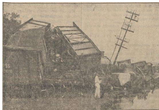
Gambar 2. Kondisi kereta api pasca tersapu aliran banjir di Cikarang.