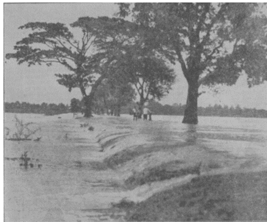
Gambar 1. Kondisi jalan penghubung antara Bekasi dan Karawang pasca banjir.

Banjir kembali mendatangi Bekasi pada 17 Maret 1933 yang saat itu sedang berada pada puncak musim penghujan. Hujan saat itu sangat deras hingga dikatakan memecahkan rekor hujan tahun-tahun sebelumnya. Hujan tersebut memaksa aliran Sungai Citarum meluap di dua lokasi, yaitu Bekasi dan Bogor. Luapan air tersebut akhirnya menjebol pintu air Cibitung yang ketika itu baru dibangun ( De Koerier, 1933 ).