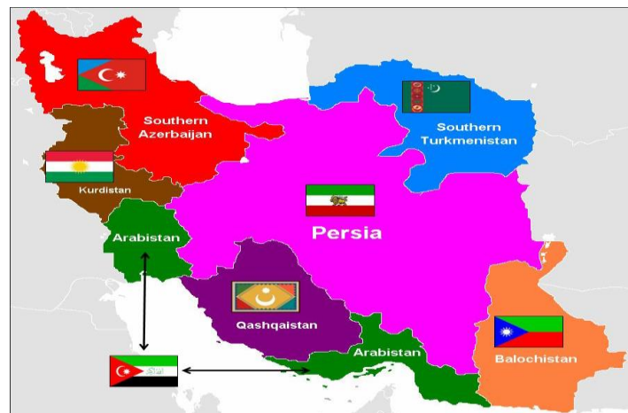
Gambar 2. Wilayah Pembagian Iran berdasarkan goetnisitas.

Pemerintah pusat telah mengelu-arkan surat edaran melarang berbahasa Arab untuk mata pelajaran akademis yang kebanyakan murid dan gurunya orang Arab. Meskipun tidak mungkin memperoleh surat edaran atau keputusan berkaitan dengan larangan penggunaan bahasa Arab di masyarakat dan tempat umum, banyak laporan menunjukkan bahwa pem-batasan dan larangan tersebut diberlaku-kan secara luas dan tidak resmi (Justice for Iran,2013:6). Pemerintah Iran di ba-wah sistem Mullah Syiah membatasi etnis Arab dengan melebur ke dalam budaya Persia bertujuan agar tidak berkembang-nya paham Pan-Arabisme dan radikalis-me yang berupaya menjatuhkan pemerintah.