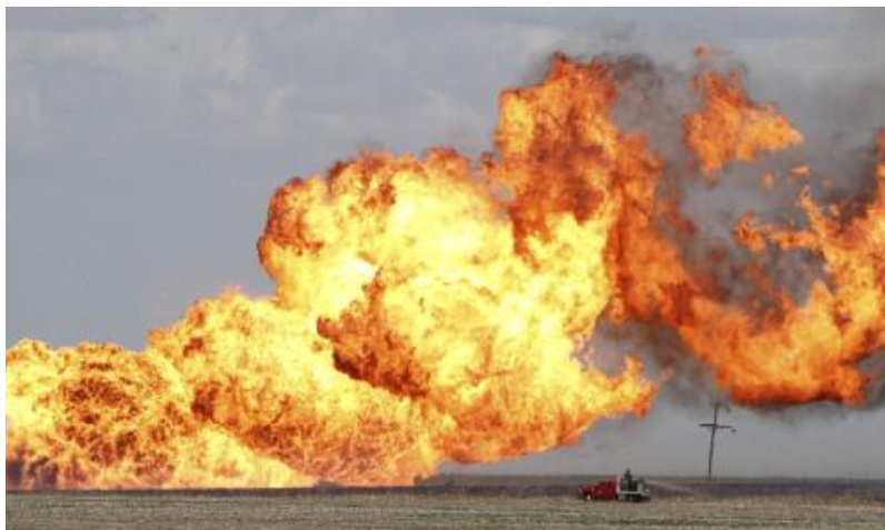
Gambar 3. Kilang Minyak yang dibakar pejuang Arab Ahvaz (Sumber: DSPA, 2013).

kolonialisme Inggris yang mengintegrasikan Ahvaz ke wilayah Iran demi kepentingan politik-ekonomi Inggris. Gerilya menjadi wadah militer rakyat Ahvaz yang efektif ketika langkah politik lokal mereka dibungkam dengan cara pengerahan IAF maupun meneruskan program Persianisasi.