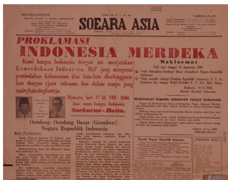
Gambar 2. Berita Kemerdekaan (Soeara Asia, 18 Agustus 1945)