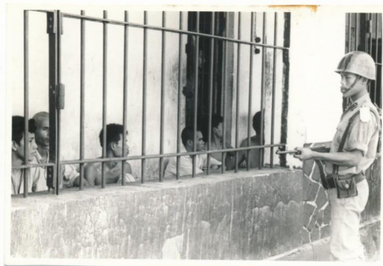
Gambar 1. Pemeriksaan Tahanan Politik PKI di Tangerang

Plantungan dan Pulau Buru, para tahanan harus mengelola pengobatan mereka secara mandiri.