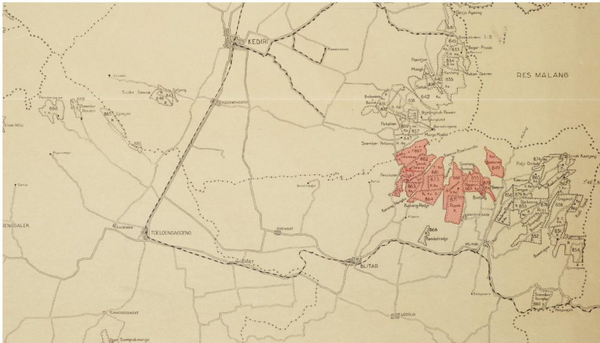
Gambar 1. Peta Karesidenan Kediri, Surabaya dan Madiun Timur (1947) yang didalamnya terletak perkebunan yang berada di wilayah lereng selatan Kelud, Blitar. Sumber: KITLV, Residentie Kediri, Soerabaja En Oost-Madioen, http://hdl.handle.net/1887.1/Item:1995995

Mulai berkembangnya perkebunan di wilayah ini ditandai dengan meningkatnya jumlah perusahaan perkebunan yang beroperasi. Perusahaan-perusahaan tersebut mengembangkan berbagai jenis komoditas seperti kopi, tebu, karet, dan kina, yang ditujukan untuk memenuhi kebutuhan pasar global (Sasmita, 2011). Mayoritas komoditas kopi dan karet dihasilkan oleh perkebunan yang berada di distrik Gandusari dan Garum dengan memanfaatkan kesuburan tanah vulkanik di kawasan lereng Kelud. Beberapa perkebunan tersebut diantaranya Nyunyur, Ngusri, Jurang Banteng, Karanganyar, dan Karangrejo (Algemeen Handelsblad, 1935). Handels Vereeniging Amsterdam (HVA) sebuah perusahaan besar pada masanya, juga memiliki aset yang luas di wilayah ini. Salah satu kebun yang dikelola HVA adalah perkebunan Bendoredjo, yang merupakan penghasil ketela pohon dan digunakan untuk produksi tapioka serta serat nanas. Selain itu, HVA juga memiliki aset lainnya di distrik Gandusari seperti perkebunan karet di Papoh, dan perkebunan kopi Nyunyur (Algemeen Handelsblad, 1935). Hingga masa akhir kolonial, ekspansi perusahaan-perusahaan perkebunan di wilayah ini mencapai puncaknya dengan menguasai lebih dari 5000 hektar lahan yang terbagi dalam 14 areal wilayah (lihat peta gambar 1).