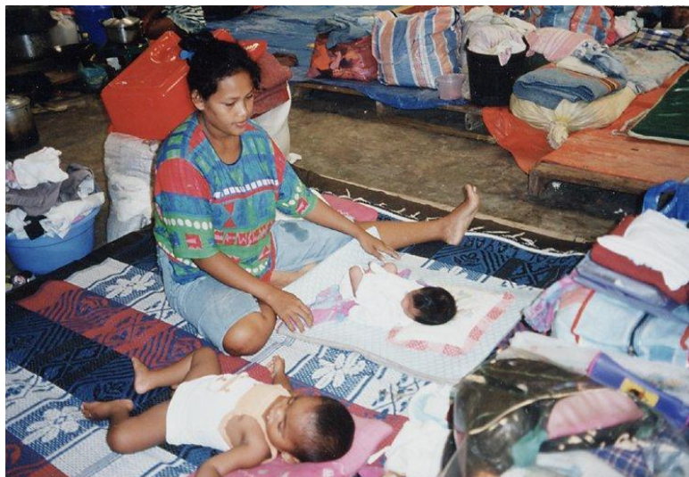
Gambar 2. Kamp pengungsi warga Waai Tahun 1999.

Konflik membawa konsekuensi langsung bagi semua masyarakat kota Ambon, banyak rumah yang terbakar dan akibat aksi penyerangan mereka harus kehilangan semua harta benda. Untuk menyelamatkan diri mau tak mau mereka harus mengungsi. A.L menceritakan bahwa rumahnya yang terletak di kawasan Rumah Tiga ikut menjadi korban kebakaran akibat konflik yang terjadi. Pada saat saya melakukan wawancara dengan A.L pada bagian ini, A.L menceritakan sambil menangis, A.L merasa sangat terpukul ketika ayahnya mengabarkan bahwa rumah mereka telah hangus dilalap api. Kesedihan makin mendalam saat melihat keluarganya yang kehilangan tempat tinggal. Akhirnya, mereka terpaksa mengungsi ke rumah kerabat. Sebelum kebakaran terjadi, A.L dan keluarganya sudah beberapa kali mengungsi untuk menghindari serangan. Setelah situasi mulai mereda, mereka sempat kembali ke rumah. Namun, setelah rumah mereka benar-benar terbakar, mereka harus mengungsi dalam waktu yang cukup lama. Kebakaran tersebut juga menyebabkan sebagian besar harta benda milik keluarga A.L hilang dalam sekejap (A.L, 7 April 2025).