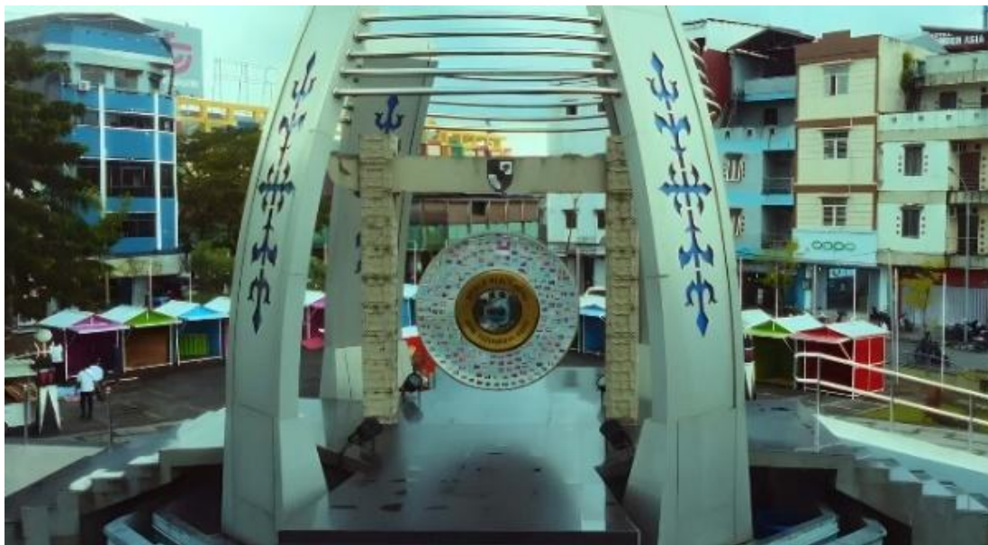
Gambar 1. Gong Perdamaian Dunia 26, September 2024.

hanya berfungsi secara praktis, melainkan juga sebagai penanda jejak sejarah dalam kesadaran sosial (Grethlein, 2008). Selain itu, William Fowler dalam tulisannya Memory Material and Material Memory: The Film Archive of Peter Whitehead menguraikan bahwa material memory dapat berupa media atau benda fisik seperti arsip film, yang merekam bukan hanya informasi visual, tetapi juga menyimpan nuansa teknis, emosional, dan budaya dari masa lalu. Unsur-unsur seperti bahan film, kerusakan fisik, serta atmosfer zamannya mampu menghidupkan kembali ingatan yang tersembunyi melalui proses pemutaran dan penafsiran ulang oleh penonton atau peneliti (Fowler, 2011). Oleh karena itu, dalam konteks tulisan ini, tiang listrik dan suara khasnya dapat dilihat sebagai semacam “alarm historis” yang membangkitkan kembali ingatan kolektif masyarakat akan masa krisis. Selain tiang listrik, simbol material lainnya yang penting dalam lanskap memori Maluku adalah Gong Perdamaian Dunia di Kota Ambon, yang juga berfungsi sebagai penanda visual dan emosional dari upaya rekonsiliasi pasca konflik.