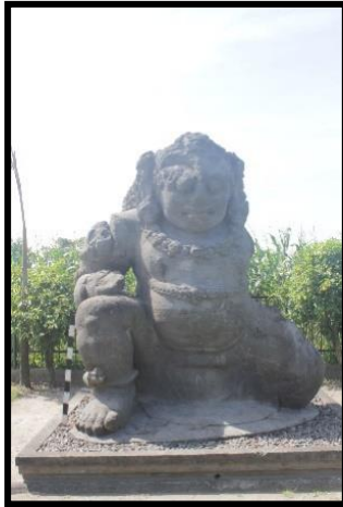
a. Tampak Depan