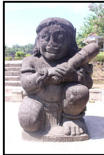
b. Arca Kiri