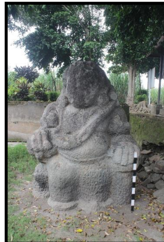
a. Arca Kiri