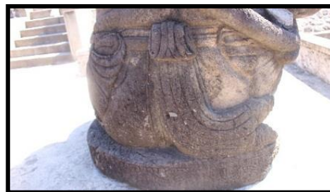
c. Ikatan Kain