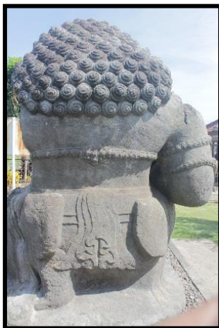
b. Tampak Belakang