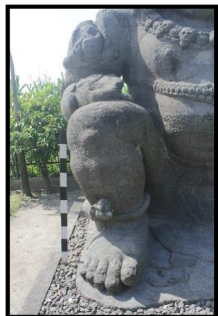
c. Posisi Kaki