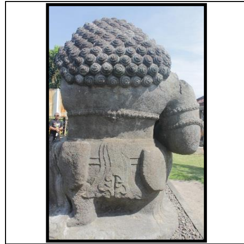
d. Ikatan Kain