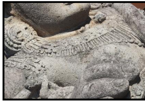
a. Arca Kiri

Gaya busana dwarapala raksasa Candi Panataran dapat kita jabarkan sebagaimana berikut. Gaya rambutnya cukup unik, rambut depan digambarkan lurus dengan guratan-guratan garis rambut seperti disisir.