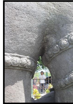
d. Bulu Halus