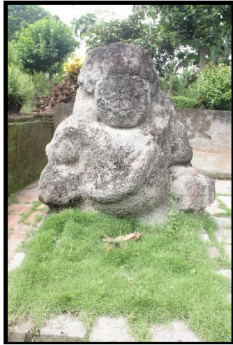
c. Arca Kanan