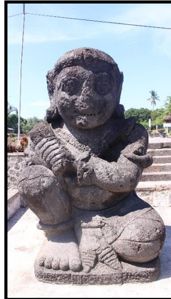
a. Arca Kanan

Gaya busana arca dwarapala akan menguraikan segala jenis cara berbusananya dan juga asesoris yang digunakan. Pemerian dilakukan dari umum ke khusus secara berurutan mulai pakaian keseluruhan, bagian kepala, tubuh dan juga benda yang dibawa. Bagian kepala juga dibahas tata rambut yang dikenakan. Ciri-ciri umum arca dwarapala terdiri dari ikat kepala ( jamang ), subang ( kundala ), kelat bahu ( keyura ), kalung ( hara ), gelang tangan ( kankana ), sabuk ( katibanda ), gelang kaki ( binggel ), dan tali kasta ( upavita ). Laksana yang dibawa adalah senjata ( gada ) dan kadang membawa tali jerat (Putra, 2005:6; Raharjo, 1986:30-31)