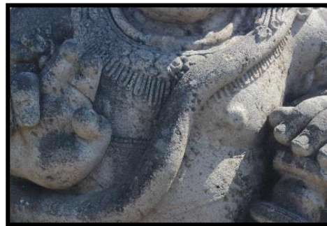
b. Arca Kanan