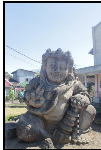
b. Arca Kanan