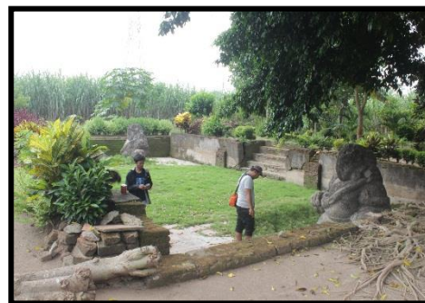
b. Situs Raos Pacinan