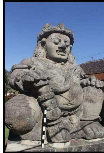
a. Arca Kiri

kiri menggenggam tangkai gada yang kondisinya tinggal separuh karena ujung gada telah patah.