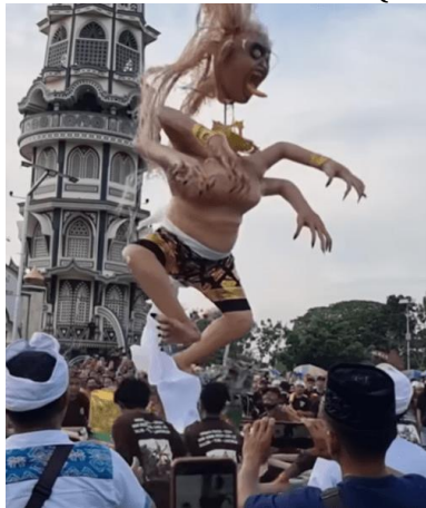
Gambar 3. Prosesi Ogoh-Ogoh Desa Balun