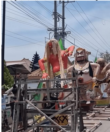
Gambar 2. Ogoh-Ogoh Desa Balun

“islam, Kristen juga membantu, pada waktu pelaksanaan itu keamanannya, bahkan kadang sampai ikut membopong.... keamanan ogoh-ogoh itu terjaga oleh pemuda Kristen dan islam, karang taruna, Masyarakat lain, dikawal. Tanpa meminta, tanpa mengumumkan mereka semua datang entah dari pemuda gereja, pemuda masjid, semua ikut membantu....” (TD, November 2025)