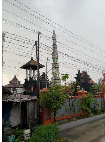
Gambar. 1 Pura dan Masjid