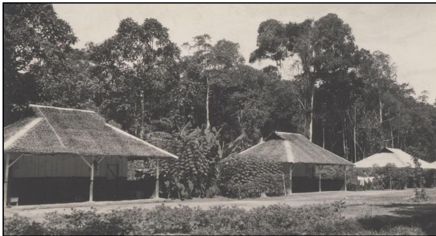
Gambar 2. Deretan Rumah Kulil Jawa di Brussel Milik Perkebunan Sumcama (1938)