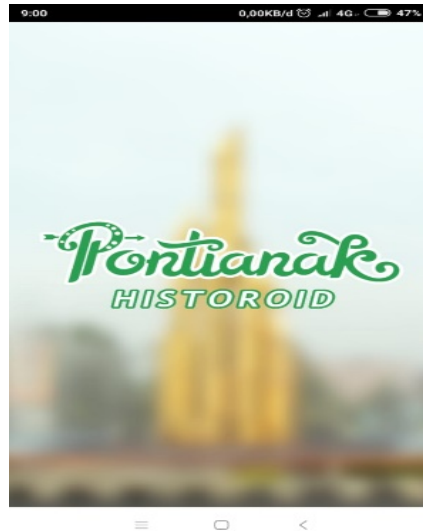
Gambar 1. Splashscreen

Splashscreen merupakan halaman awal ketika pengguna (dalam hal ini Siswa) membuka aplikasi “Pontianak Heritage” dengan nama Pontianak Historoid ( Pontianak History on Android ).