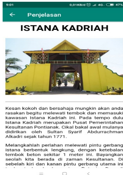
Gambar 2. Materi Mengenal Heritage Kota Pontianak

Interface materi Mengenal Heritage Kota Pontianak dirancang dengan sederhana namun memaksimalkan muatan materi berupa deskripsi dan foto dengan harapan pengguna akan lebih dapat memahami dan menggali materi yang disampaikan dalam aplikasi.