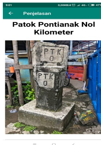
Gambar 4. Jendela Heritage Kota Pontianak

Jendela Heritage Kota Pontianak merupakan halaman yang berisikan tentang informasi salah satu heritage. Interface yang telah didesain menerapkan model parallax sehingga dapat memaksimalkan penampilan konten aplikasi berbasis deskripsi dan foto.