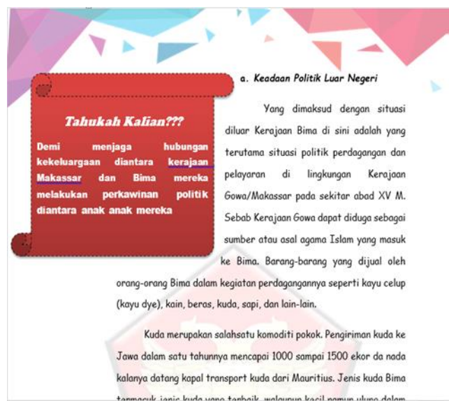
Gambar 3. Tampilan e-book

Tahap awal pada penelitian pengembangan ini adalah melaksanakan validasi materi. Tujuan dari validasi materi dalam pengembangan ini yakni agar mendapatkan kevalidan atau kelayakan pada suplemen e-book. Proses validasi materi yakni dilaksanakan dengan cara menyerahkan draf materi kemudian dilengkapi dengan lembar penilaian berupa angket. Validasi ahli materi dalam penelitian pengembangan ini yakni Dr. R, Reza Hudyanto, S.S., M.Hum. beliau adalah dosen S2 Pendidikan Sejarah Pascasarjana Fakultas Ilmu Sosial Universitas Negeri Malang. Berdasarkan data hasil dari validasi materi diketahui kevalidan materi pada bahan ajar e-book mencapai persentase 87%. Dari hasil tersebut jika dikonversi kevalidan materi dapat dikategorikan “sangat valid”. Dalam validasi materi, validator juga memberikan kritik dan saran yakni materi sudah baik dan bisa diteruskan sesuai saran ke langkah berikutnya.