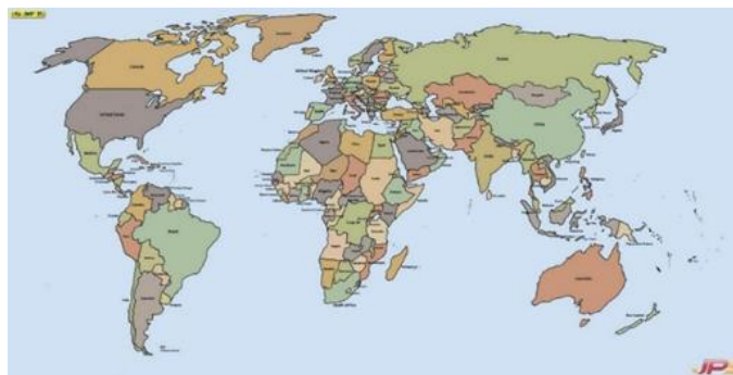
Gambar 1. Peta Dunia

Apakah kamu tahu di mana letak benua Eropa di peta dunia? (Jawaban yang benar: benua Eropa terletak di bagian kiri atas peta dunia)