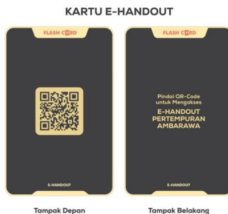
Gambar 1. Tampilan kartu untuk mengakses e-handout

Cara menggunakan kartu yaitu dengan dimainkan secara berkelompok. Peneliti membagi kelas dibagi kedalam 7 kelompok, dengan setiap kelompok berjumlah 5 orang. Setiap kelompok diberikan satu set flashcard , yang berisi 20 lembar kartu. Sebelum memainkan permainan peneliti menjelaskan petunjuk penggunaannya yaitu, peserta didik memilih urutan anggota yang akan bermain, kemudian dua peserta didik pertama memainkan kartu dengan membelakangi 3 peserta didik lainnya. Dua peserta didik tersebut terdiri dari satu peserta didik sebagai penebak yang satunya lagi sebagai pemantik dengan memberikan clue yang sudah tertera pada kartu bagian belakang. Semakin banyak clue yang dibacakan, maka nilai yang diterima oleh penebak semakin sedikit, dan begitu sebaliknya. Ketika penebak telah selesai melakukan misinya maka ia menjadi pemantik untuk peserta didik selanjutnya, dan berlangsung bergantian.