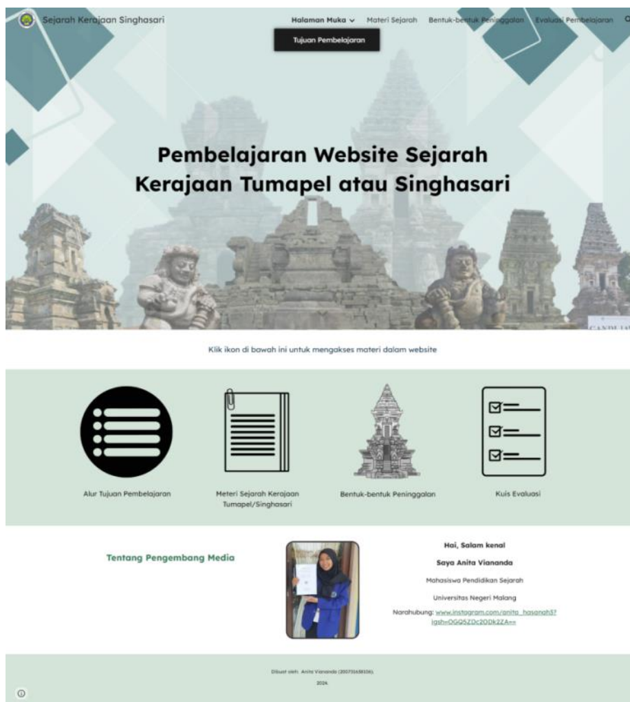
Gambar 1. Tampilan halaman utama persija.