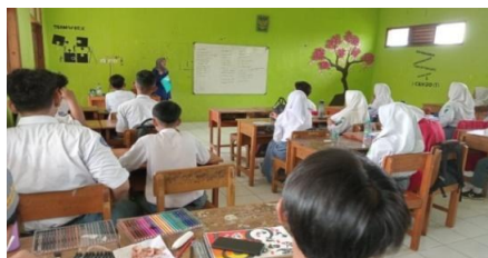
Gambar 1. Proses uji coba di kelas X DKV 2.

Penilaian media masih menggunakan sistem yang sama yaitu angket dengan skala likert dan dengan kategori dan indikator yang sama. Skor maksimal pada setiap indikator angket kelompok besar yang bisa didapatkan adalah 80 poin, dengan skor maksimal penilaian keseluruhan 2160 poin. Hasil uji coba terhadap kelompok besar diperoleh jumlah skor keseluruhan senilai 1,878 poin. Setelah dilakukan analisis mengenai perolehan nilai uji coba kelompok besar maka diperoleh persentase senilai 86% (Delapan puluh enam persen). Sehingga media persija dapat dikatakan sangat efektif dan layak digunakan hal ini berdasarkan ketetapan kriteria yang digunakan.