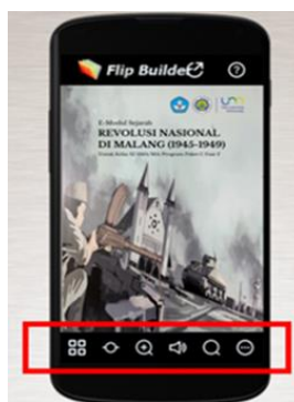
Gambar 1. Tampilan Akhir E-Modul Diakses Menggunakan Handphone

Secara spesifik, tampilan e-modul terdiri dari: 1) sampul depan dan belakang ( cover ), 2) daftar isi e-modul, 3) petunjuk penggunaan untuk peserta didik dan pendidik, 3) identitas e-modul, 4) peta konsep materi, 5) apersepsi e-modul berupa video dan gambar, 6) halaman materi pembahasan yang disusun semenarik mungkin dengan unsur multimedia, terdiri dari teks, gambar, audio, hingga video terkait materi Revolusi Nasional di Malang tahun 1945-1949, 7) tampilan evaluasi dan refleksi diri yang dikemas secara inovatif, 8) glosarium, 9) daftar rujukan, dan 10) identitas pengembang. Kemudian, keseluruhan tampilan akhir e-modul dilengkapi dengan beberapa tombol seperti tombol thumbnails yang berfungsi menunjukkan semua halaman e-modul, tombol pengaturan halaman berfungsi memudahkan menuju halaman yang diinginkan, tombol zoom out dan zoom in berfungsi memperbesar dan memperkecil tampilan e-modul, tombol suara flip , tombol pencarian kata dan tombol pengaturan lainnya, sehingga mudah diakses dan digunakan oleh peserta didik (lihat pada gambar 1.).