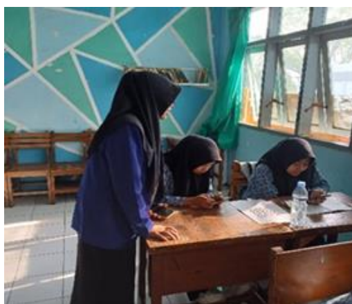
Gambar 4. Uji Coba Penggunaan E-Modul Multimedia oleh Peserta Didik Kelompok Kecil

Pada hari yang sama, Uji coba produk validasi kelayakan oleh kelompok kecil sebagai tahap uji coba awal dalam penggunaan bahan ajar e-modul multimedia berbasis flip PDF-corporate materi Revolusi Nasional di Malang tahun 1945-1949 dalam pembelajaran dilakukan hari Kamis, tanggal 21 November 2024 di Kelas XI-IPS 3 dengan melibatkan pemberian angket kepada 6 peserta didik sebagai responden. Pemilihan peserta didik dilakukan secara simple random sampling untuk mengetahui tingkat validasi kelayakan pada tahap uji coba awal ini. Uji coba produk validasi kelayakan oleh kelompok kecil terbagi menjadi 2 aspek, yaitu kelayakan isi dan kelayakan penggunaan unsur multimedia e-modul (lihat gambar 4).