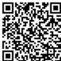
Gambar 2. Tampilan Link E-modul yang Dapat Diakses Pengguna