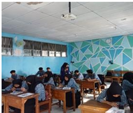
Gambar 5. Uji Coba Penggunaan Bahan Ajar E-Modul Multimedia oleh Peserta Didik Kelompok Besar

peserta didik sebagai responden, peserta didik yang sebelumnya pada tahap uji coba awal belum memberikan penilaian. Uji coba produk validasi kelayakan oleh kelompok besar terbagi menjadi 2 aspek, yaitu kelayakan isi dan kelayakan penggunaan unsur multimedia e-modul (lihat gambar 5).