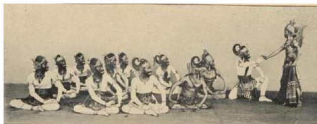
Gambar 4. Pagelaran Wayang Wong Lakon Hanoman oleh Java Instituut.

Pemajuan budaya Jawa juga dilakukan Java Instituut melalui media massa, khususnya majalah. Semenjak berdiri dan disahkan 1919, berselang dua tahun kemudian tepatnya pada 1921, Java Instituut berhasil menerbitkan majalah edisi pertamanya yang diberi nama Majalah Djawa . Ditinjau dari angka tahun penerbitannya, majalah Djawa mengalami eksistensi hingga 2 dekade. Hal ini dapat dilihat dari indeks majalah yang dibagi menjadi dua periode yakni periode 1921-1930