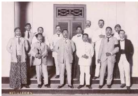
Gambar 1. Anggota Panitia dan Pemakalah Kongres Kebudayaan Jawa 1918