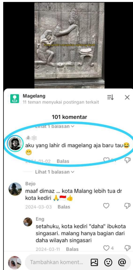
Gambar 1. Cuplikan Komentar Pengguna TikTok