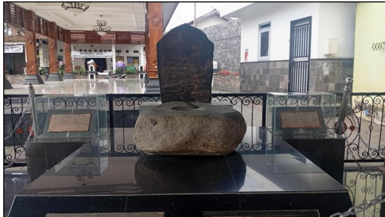
Gambar 2. Lumpang Prasasti Mantyasih