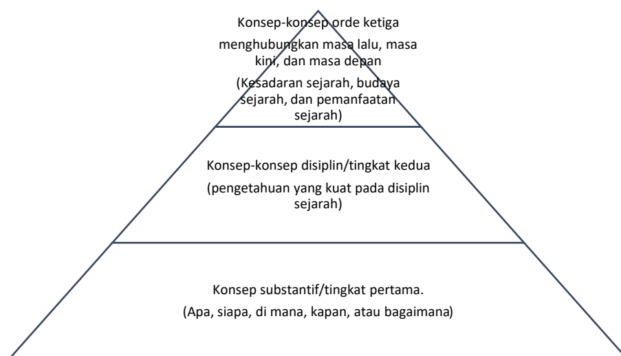
Gambar 2. Diagram tingkatan jenis pengetahuan yang diperoleh siswa saat mereka belajar sejarah.

Historical literacy sendiri menjadi sebuah keterampilan dimana siswa dapat membuat sebuah interpretasi dari sumber-sumber primer dan sekunder yang ada. (Maposa and Wassermann, 2014; Rodríguez-Moneo, Carretero and Gutiérrez-Cano, 2025). Historical literacy adalah salah satu dari prasyarat pertama yang harus dimiliki siswa, sebelum guru meningkat pada orde ketiga atau pada bagian kesadaran sejarah (Oakeshott, 1983; Rodríguez-Moneo, Carretero and Gutiérrez-Cano, 2025). Hal ini disebabkan karena jika siswa ingin mengorientasikan diri dengan peristiwa masa lalu, masa kini, dan masa depan dalam sejarah, maka diperlukan dua alat analisis yang harus dimiliki yaitu pemahaman tentang disiplin ilmu sejarah, dan kerangka kerja masa lalu yang dapat digunakan (Lee, 2005). Siswa yang belum memiliki kemampuan disiplin ilmu seperti berpikir historis dan historical literacy , tidak dapat mengkritisi narasi yang sudah ada ( grand narratives ) tetapi menerima dan menggunakan apa yang sudah ada. Hal ini membuat kesadaran yang seharusnya mulai terbentuk sejak pemahaman mengenai disiplin ilmu itu tidak dapat dilanjutkan ke tahap pengetahuan ordo ketiga.