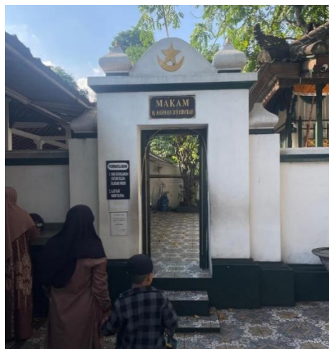
Gambar 3. Gapura dalam situs makam Gusti Ayu Made Rai (Siti Khotijah)

Pada sebelah kanan sebelum gapura dalam (paduraksa) terdapat dwarapala , yang merupakan patung penjaga dalam agama Hindu dan biasanya berada di pintu masuk tempat-tempat suci. Pada situs makam Gusti Ayu Made Rai terdapat tiga buah patung penjaga ( dwarapala ) yang dililit dengan kain khas Bali