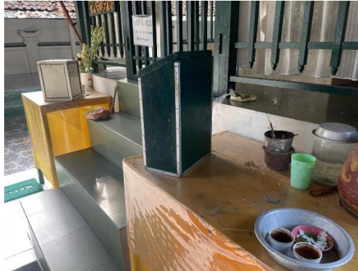
Gambar 6. Sesaji ( canang sari ) dan dupa

Selain dari segi fisik situs, terdapat fenomena menarik dan masih bertahan hingga saat ini, yaitu keberlanjutan praktik penghormatan yang dilakukan oleh masyarakat dari dua keyakinan berbeda. Bagi umat Hindu, khususnya keluarga besar Puri Badung dan krama sekitarnya, makam ini sering menjadi tempat pemujaan atau sembahyang sebagai bentuk penghormatan kepada leluhur ( ngaturang bakti ) (Juniasih et al., 2023).