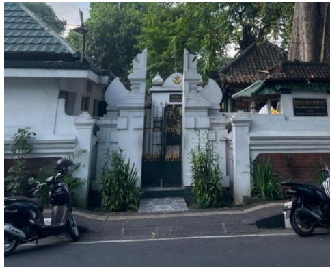
Gambar 2. Gapura luar situs makam Gusti Ayu Made Rai (Siti Khotijah)