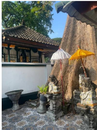
Gambar 4. Patung penjaga pintu masuk (dwarapala)