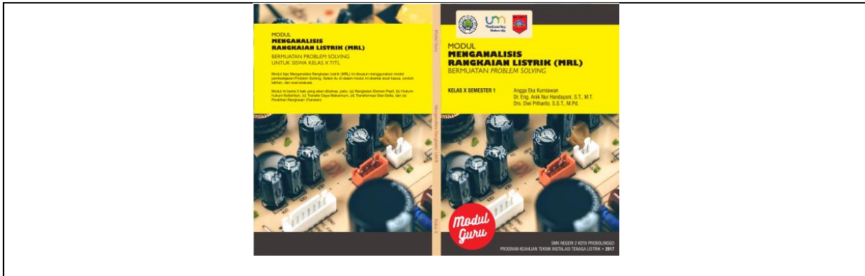
Gambar 3. Halaman Sampul Modul Guru